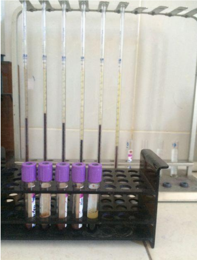
Gambar rak westergreen dan sampel darah