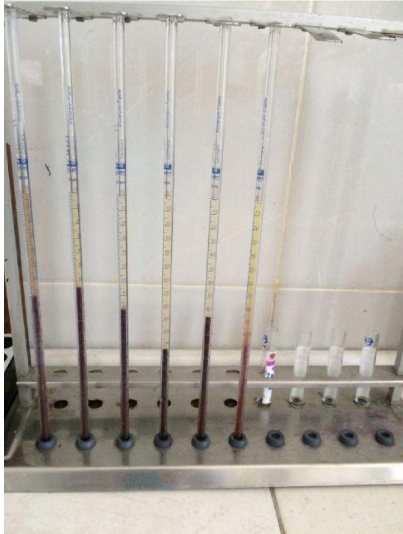
Gambar Pemeriksaan Laju Endap Darah