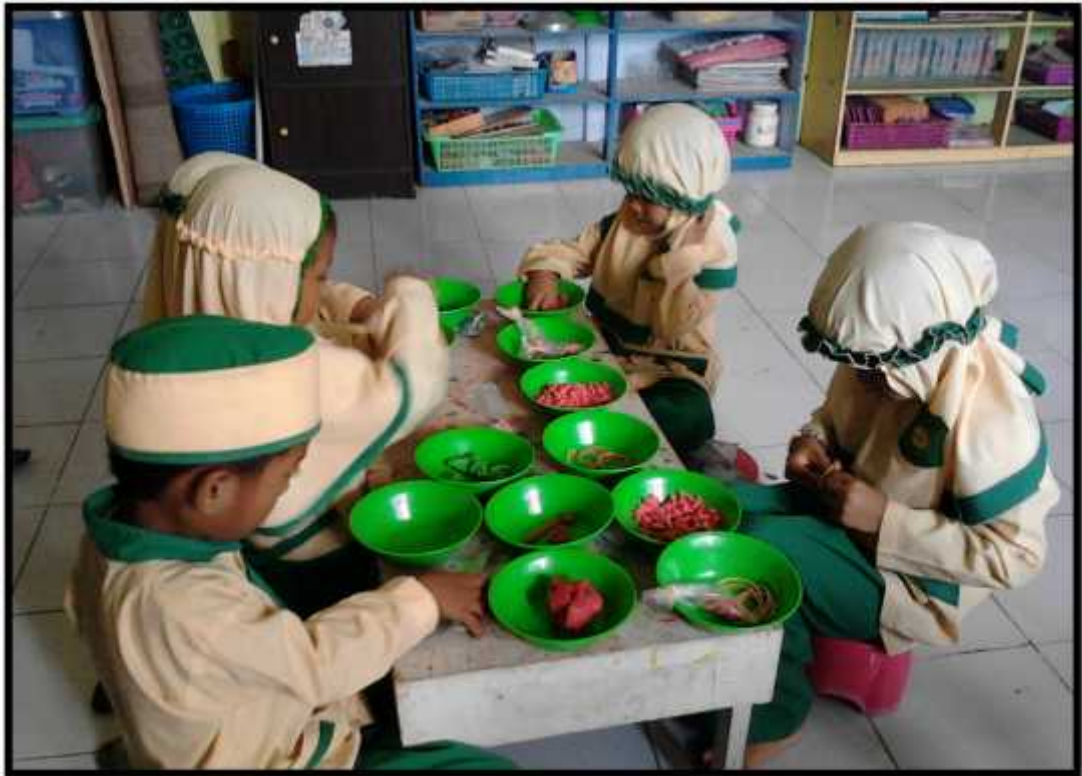
Gambar. 9 Anak-anak membuat jajan