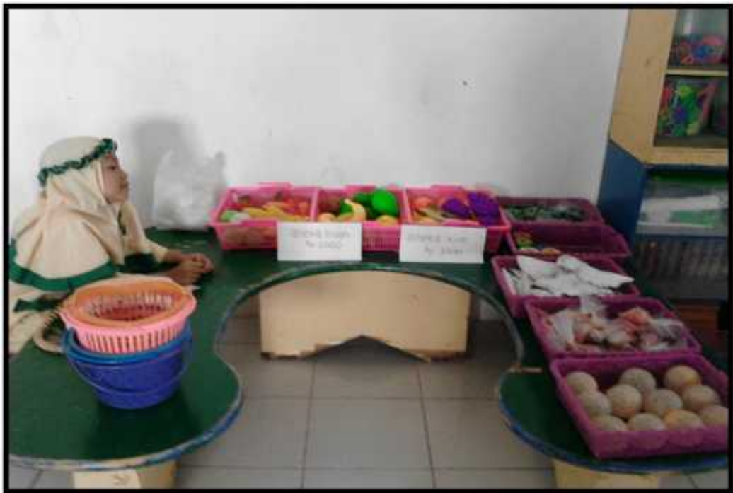
Gambar. 8 Vanes menjual aneka jajan