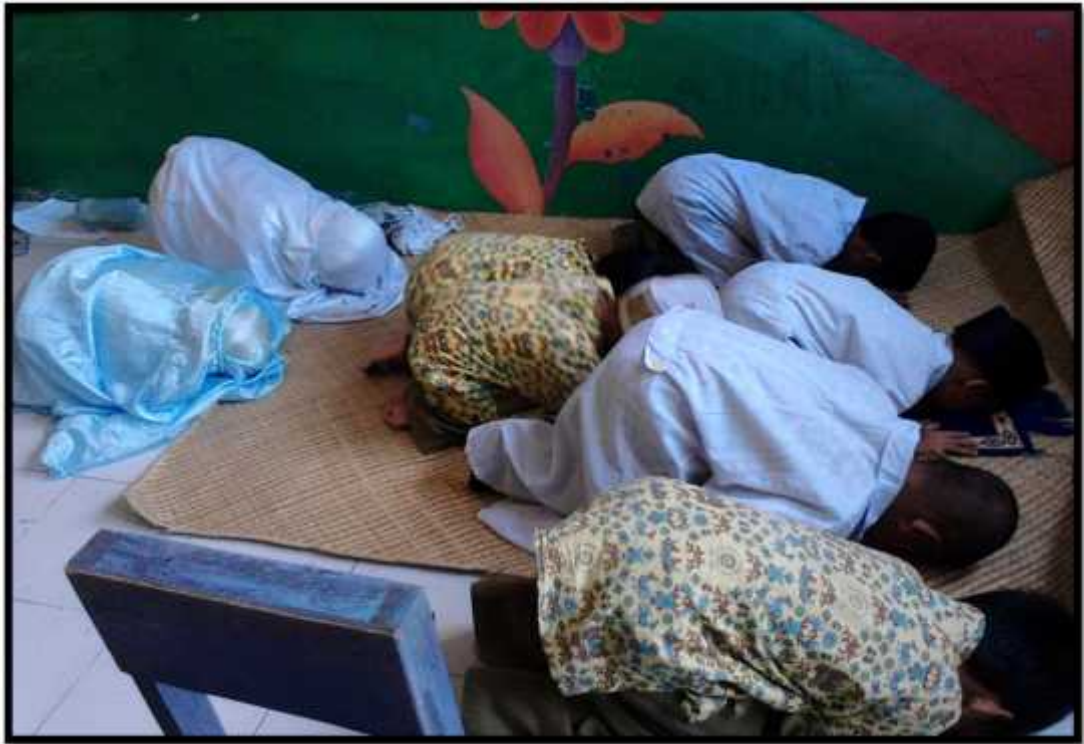
Gambar. 5 Dokter sholat bersama pasien