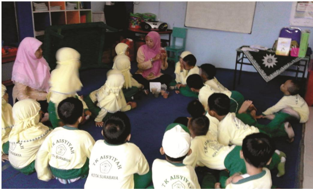
Gambar 2 : Guru menunjukkan beberapa macam biji - bijian