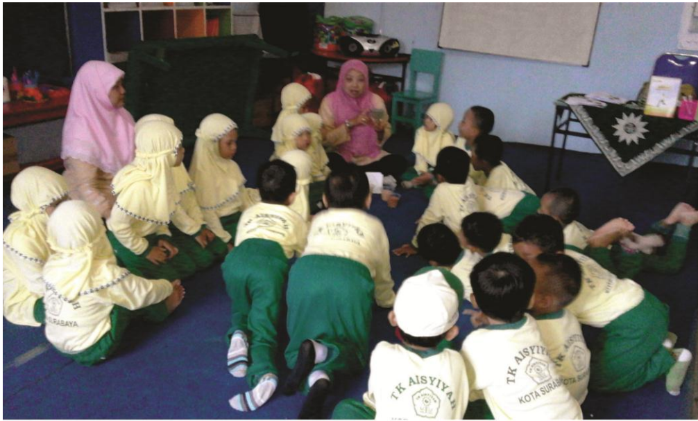
Gambar 1 : Guru menjelaskan media pembelajaran