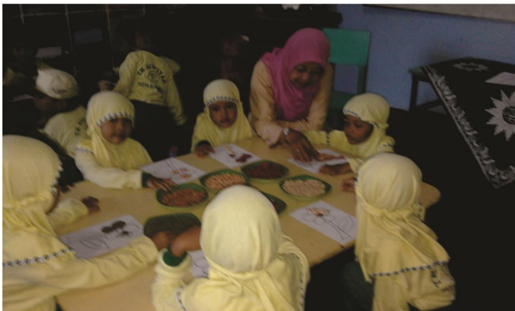
Gambar 8 : Proses pembelajaran