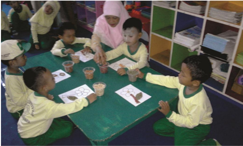
Gambar 7 : Guru membimbing proses pembelajaran