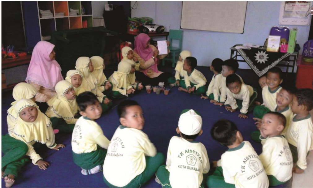
Gambar 3 : Guru menjelaskan pola yang akan digunakan untuk menempel