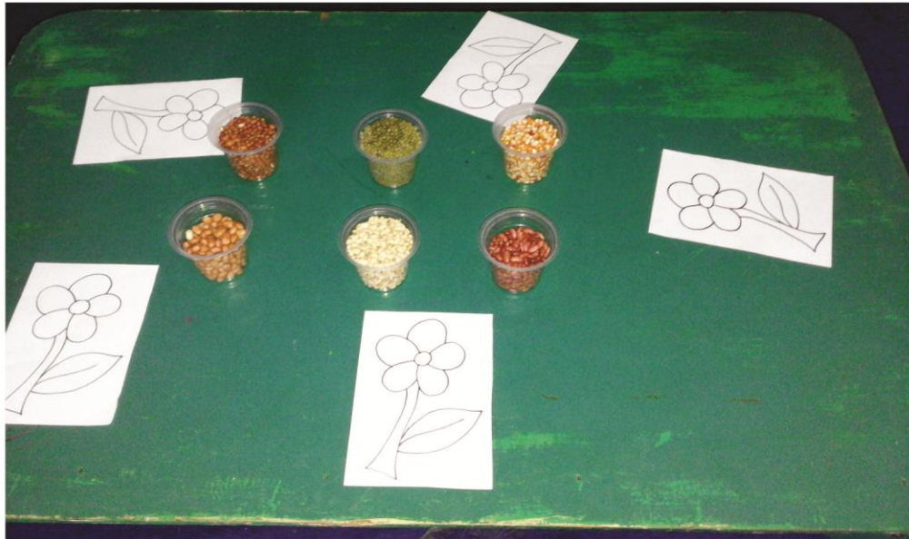
Gambar 6 : Gambar pola yang akan digunakan untuk menempel