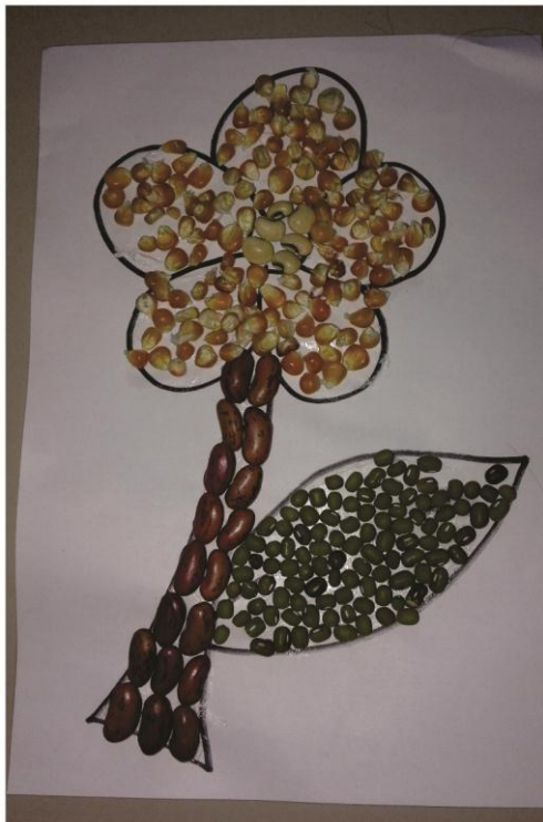
Gambar 10 : Hasil karya anak