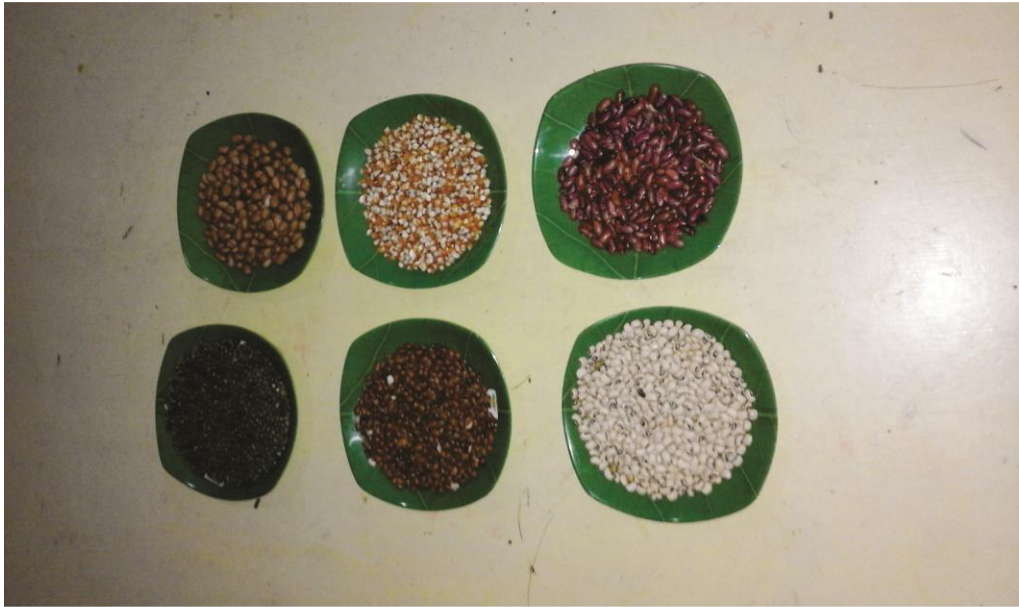
Gambar 5 : Media biji - bijian