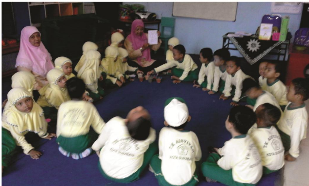
Gambar 4 : Guru menjelaskan cara menempel media biji - bijian pada pola