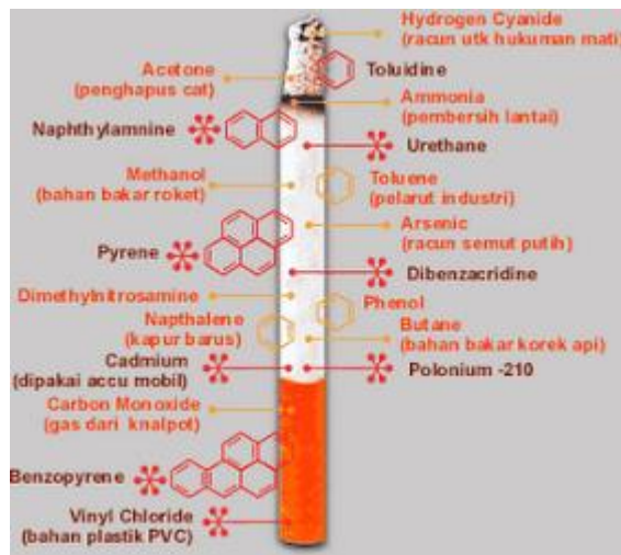
Gambar 2.1. Rokok (Nazir, 2009)

Metanol adalah sejenis cairan ringan yang mudah menguap dan mudah terbakar. Meminum atau menghisap metanol mengakibatkan kebutaan dan bahkan kematian (Anonim, 2011).