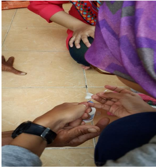
Gambar Pengambilan bahan uji