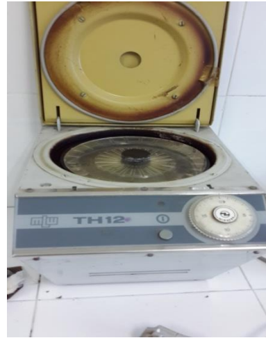
Gambar Alat Mikrosentrifuge