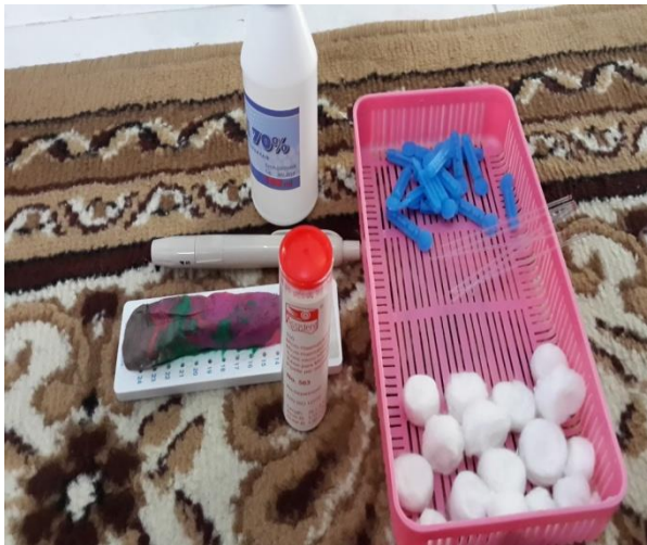
Gambar Alat yang digunakan dalam pengambilan bahan uji