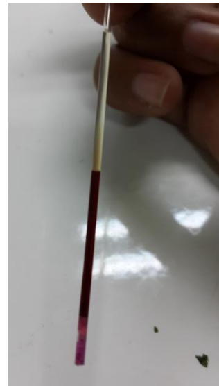
Gambar Hasil pemeriksaan hematokrit metode mikrohematokrit