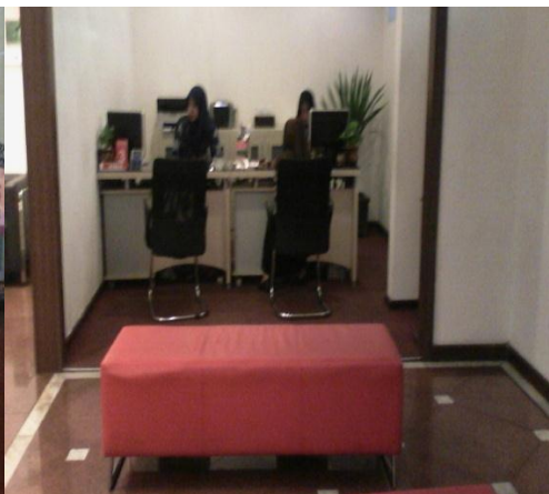
Pelayanan pada customer service