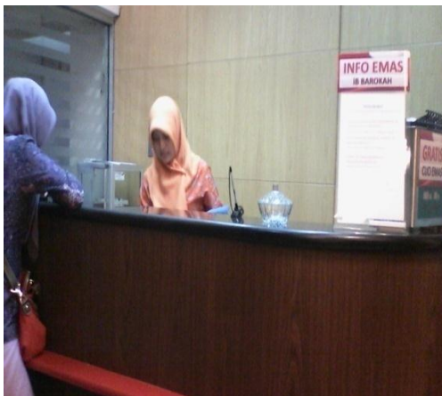
Pelayanan info Emas IB Barokah