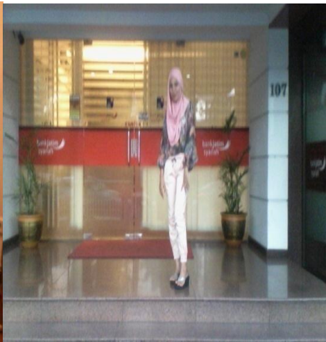
Dokumentasi kantor BJS Surabaya