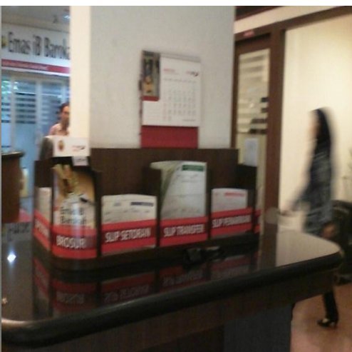
Pelayanan pada tempat slip teller