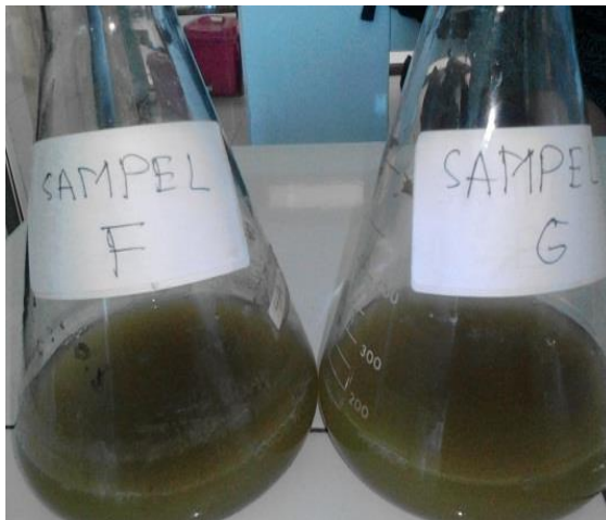
Sampel Minuman Sari Tebu