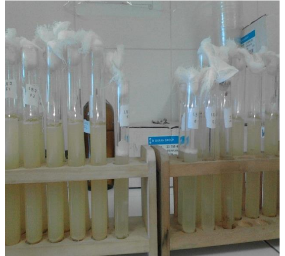
Media Brilliant Green Laktosa Bile Broth (BGLB)