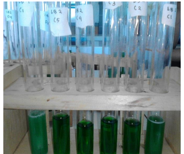
Hasil penanaman pada media Brilliant Green Laktosa Bile Broth (BGLB)