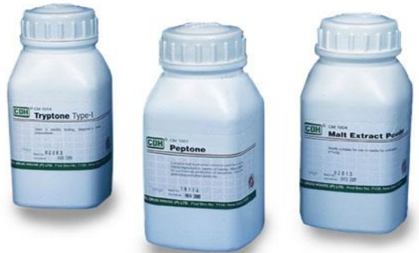
Media Peptone dan Beef Extract