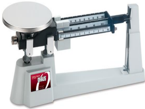
Gambar Neraca Triple Beam Balance