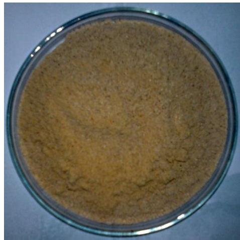
Serbuk biji papaya ( carica papaya Linn)