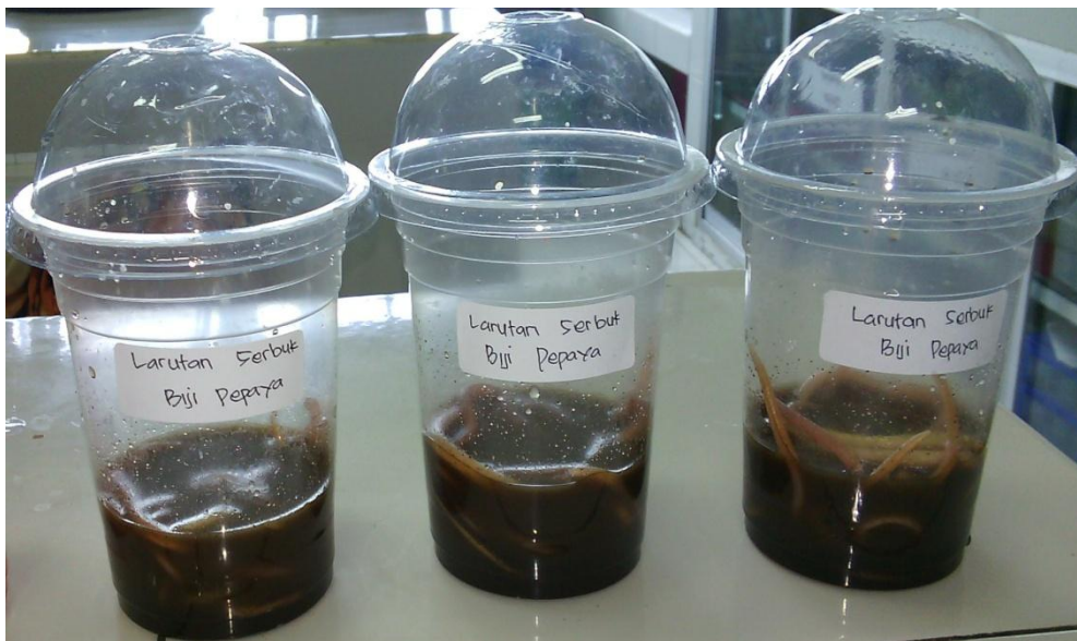
Pemberian serbuk biji pepaya ( carica papaya Linn)