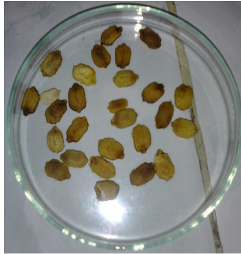
Biji papaya ( carica papaya Linn)