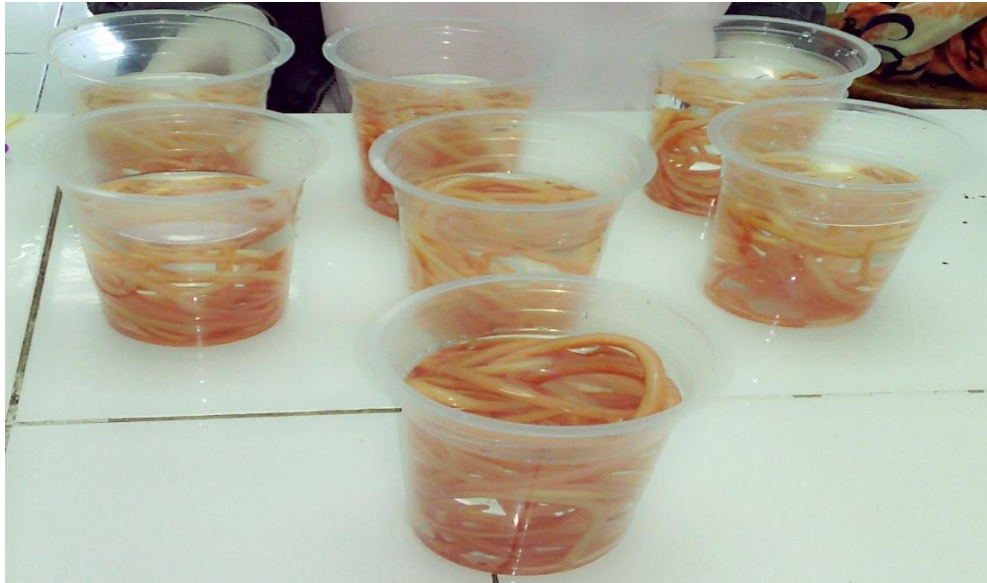
Cacing Ascaris suum goeze