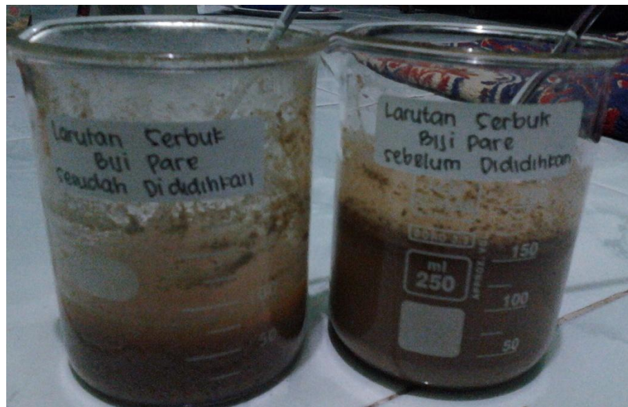
Larutan serbuk biji pare ( momordica charantia )