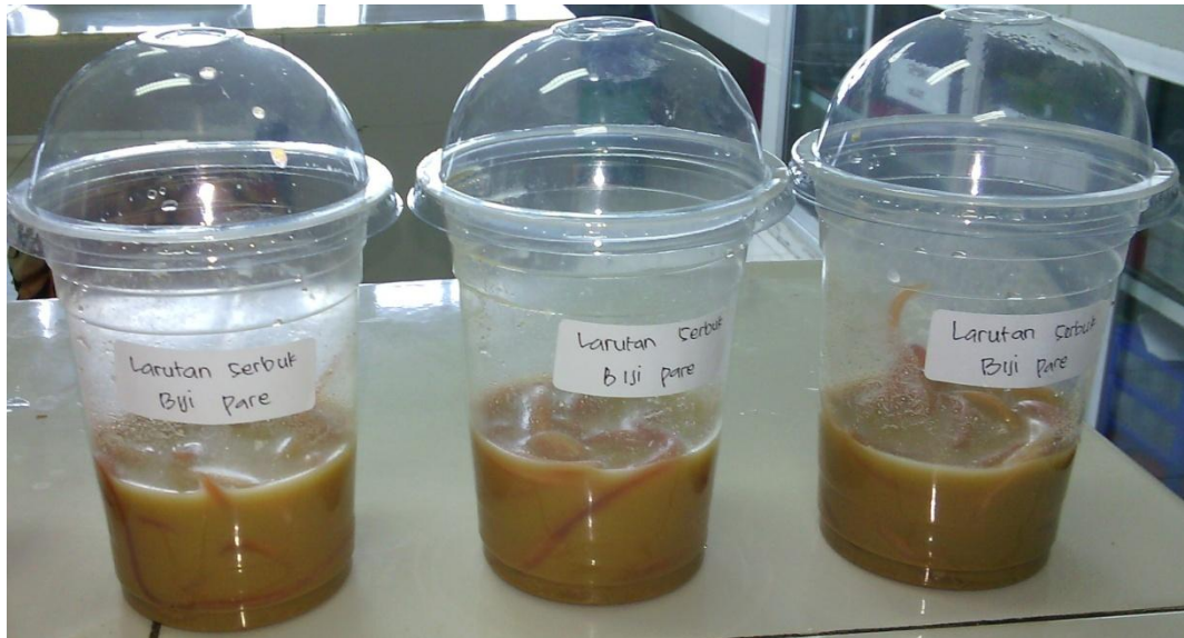
Pemberian serbuk biji pare ( momordica charantia )