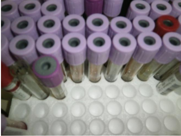
Gambar 1. Sampel Penelitian