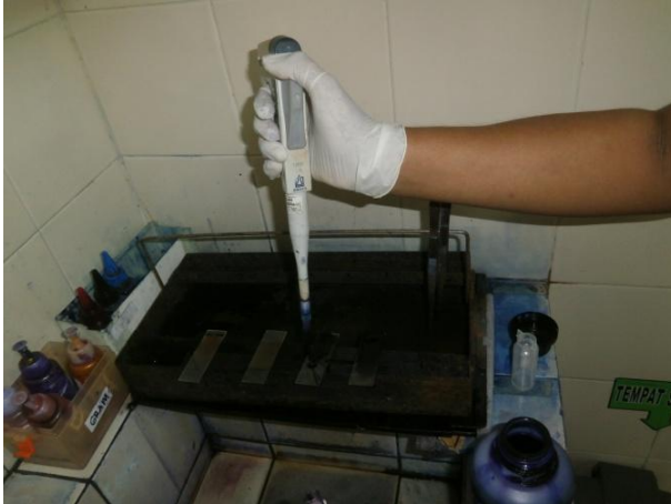
Gambar 3. Pengecatan Hapusan Darah