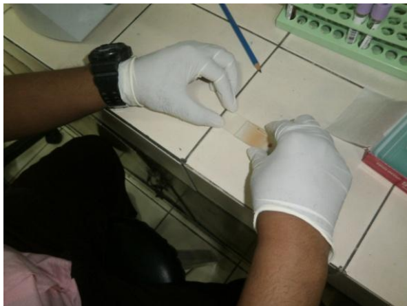
Gambar 2. PembuatanHapusanDarah