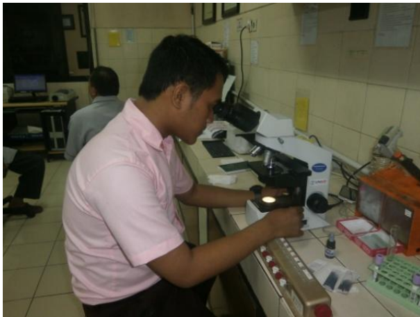
Gambar 4. Perhitungan Hapusan Darah menggunakan Mikroskop Pembesaran 100x Pada Lensa Objektif.