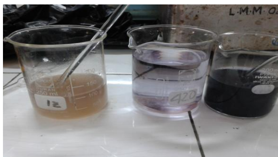
3. Contoh kontrol positif klorin