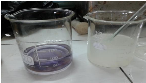
2. Hasil sampel Negatif