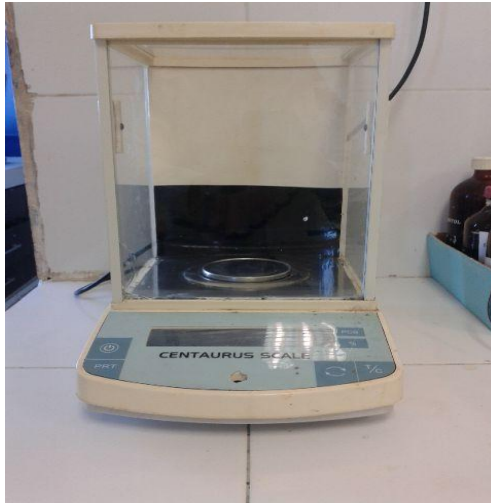
4. Timbangan Neraca