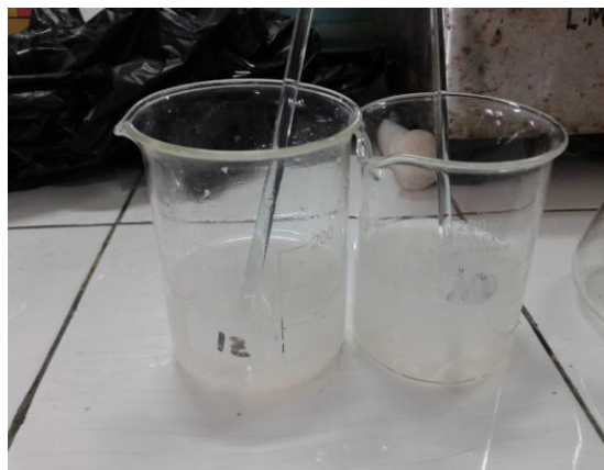
6. Pelarutan Bubur dengan 50 ml aquadest