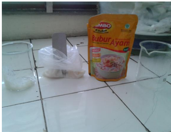
5. Sampel Bubur Ayam