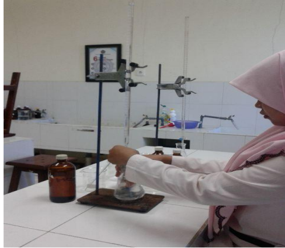
7. Perlakuan Titrasi Sampel