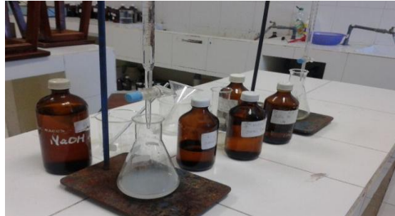
1. Hasil Titration