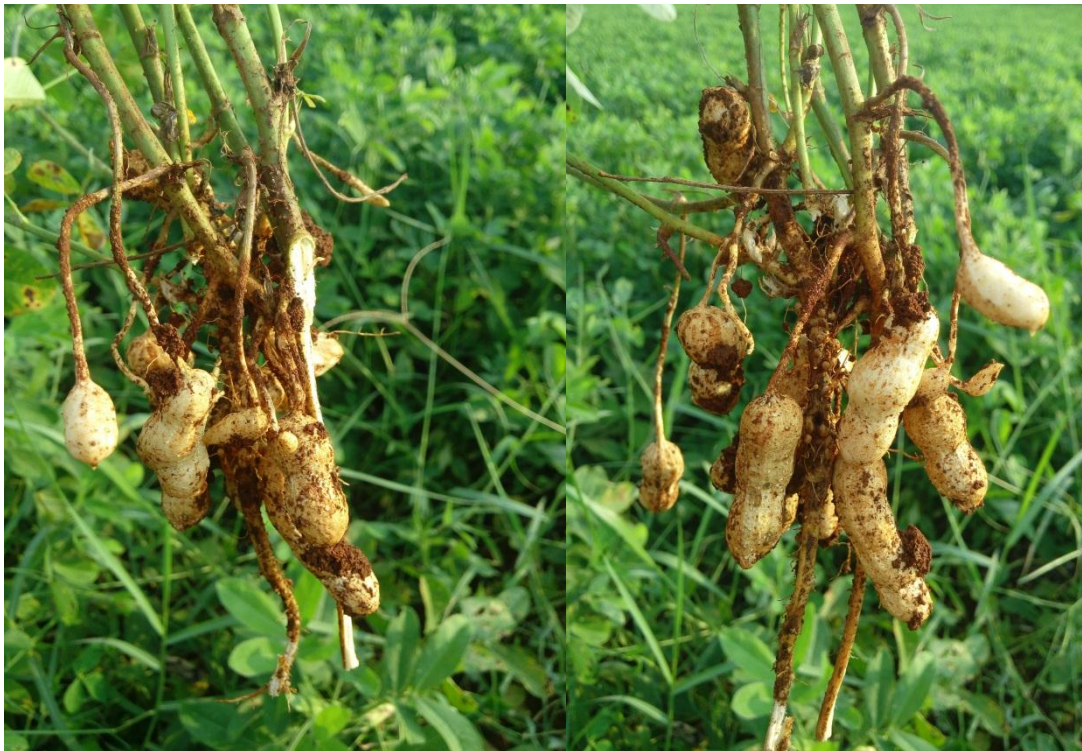
Gambar 3.6 Kacang Tanah yang sudah berumur 75-80 hari.