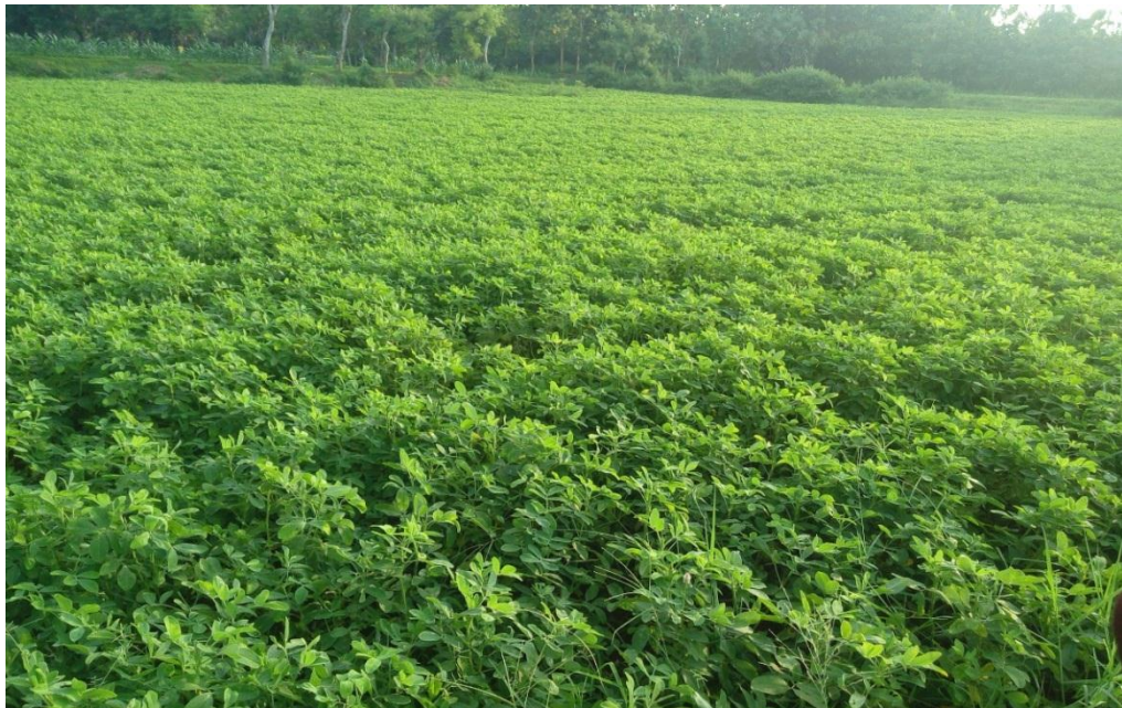
Gambar 3.5 Ladang Kacang Tanah Ketika Sudah Akad Tebasan.

Disimpulkan bahwa para penjual dan pembeli masih ragu-ragu dengan hukum dari jual beli tebasan. Penjual dan pembeli masih belum bisa mengartikan dengan jelas seperti apakah jualbeli yang termasuk dilarang Allah. Dan yang menjadi faktor yang membuat masih digunakannya jual beli ini karena sulitnya mencari tenaga buruh tani harian yang biasa disewa untuk memanen kacang tanah, yang membuat jual beli seperti ini masih berlaku sampai sekarang.