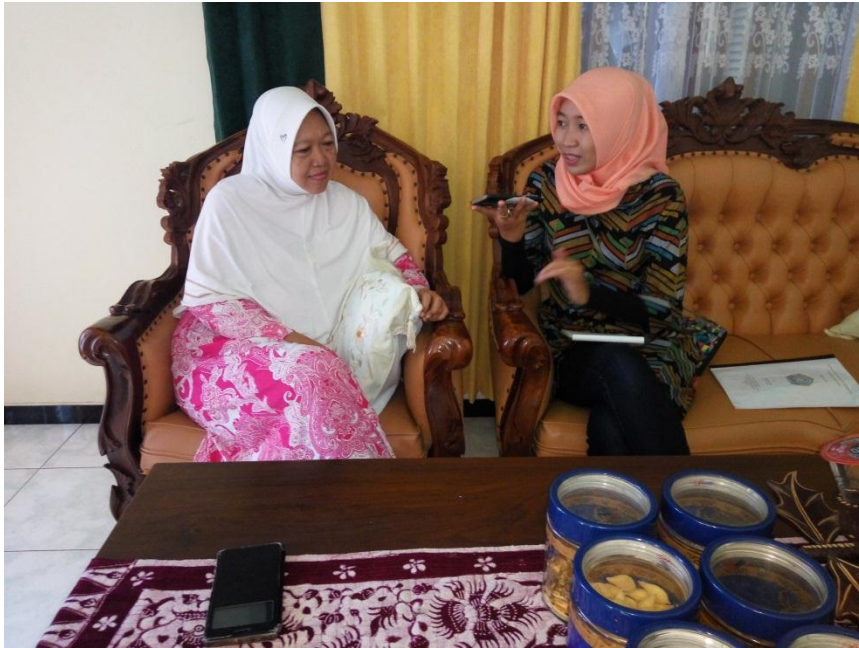
Wawancara terhadap informan kunci: Bu. RT.02/ RW.03