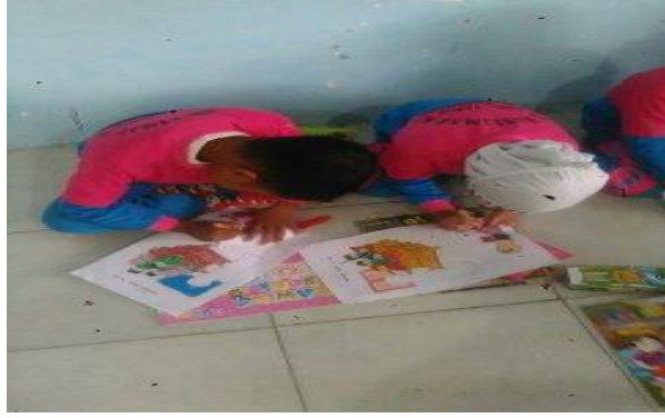
Gambar 10. Proses pembelajaran pada siklus II pertemuan 2