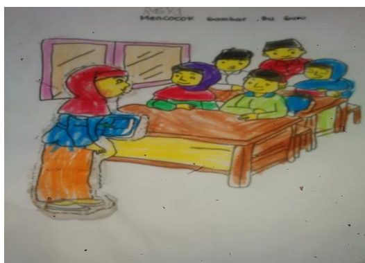
Gambar 15. Hasil mencocok gambar pada siklus II pertemuan 2