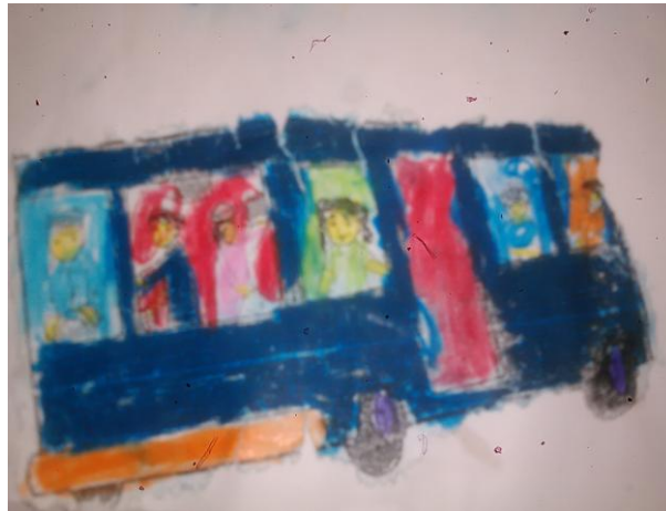
Gambar 12. Hasil Mencocok gambar pada siklus I pertemuan 1