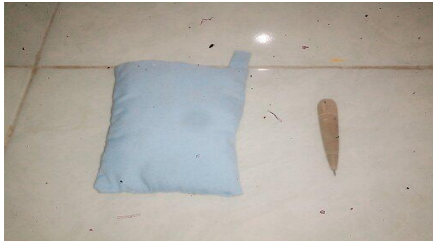
Gambar 1. Alat atau media mencocok gambar yang dipakai