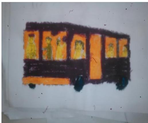
Gambar 13. Hasil mencocok gambar Pada siklus I pertemuan 2