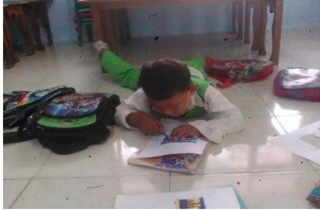
Gambar 4. Foto anak yang belum bisa memegang alat cocok dengan benar