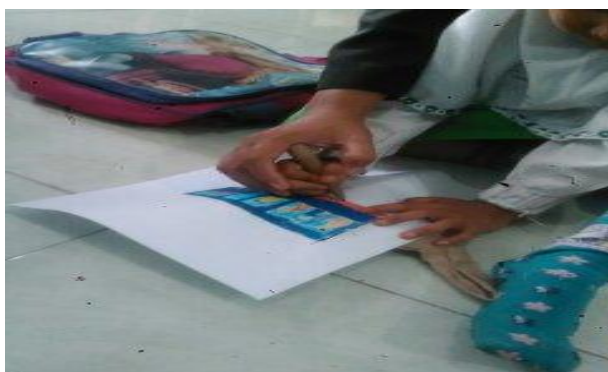
Gambar 8. Guru membantu anak dalam cara mencocok gambar