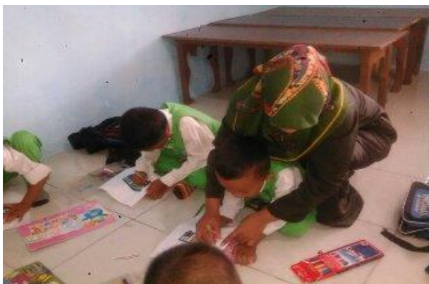
Gambar 7. Foto anak yang masih belum bisa mencocok dengan benar pada siklus II pertemuan 1