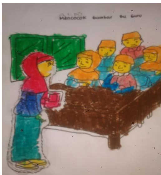
Gambar 14. Hasil mencocok gambar pada siklus II pertemuan 1