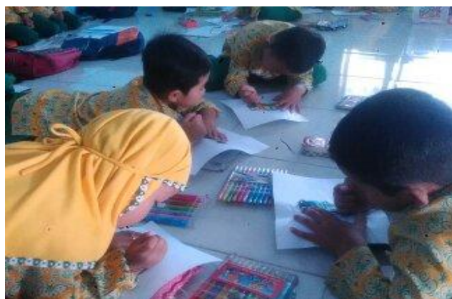
Gambar 3. Proses mencocok gambar pada siklus I Pertemuan 1