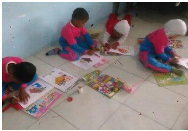
Gambar 11. Proses mencocok gambar pada siklus II pertemuan 2