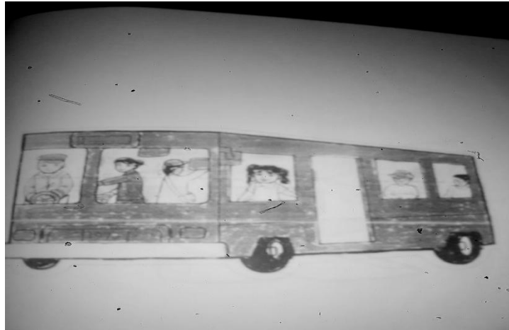
Gambar 1. Gambar mobil yang digunakan mencocok pada siklus I

Kendaraan / Transportasi adalah alat yang digunakan oleh manusia untuk bepergian. Macam-macam alat transportasi sebagai berikut: