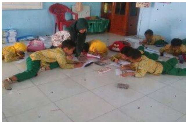
Gambar 2. Proses mencocok gambar pada siklus I pertemuan 1