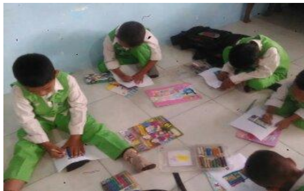
Gambar 6. Proses mencocok gambar pada Siklus I pertemuan 2