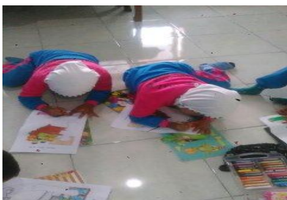
Gambar 9. Proses mencocok gambar pada siklus II pertemuan 2