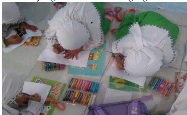
Gambar 5. Proses mencocok gambar pada siklus I pertemuan 2