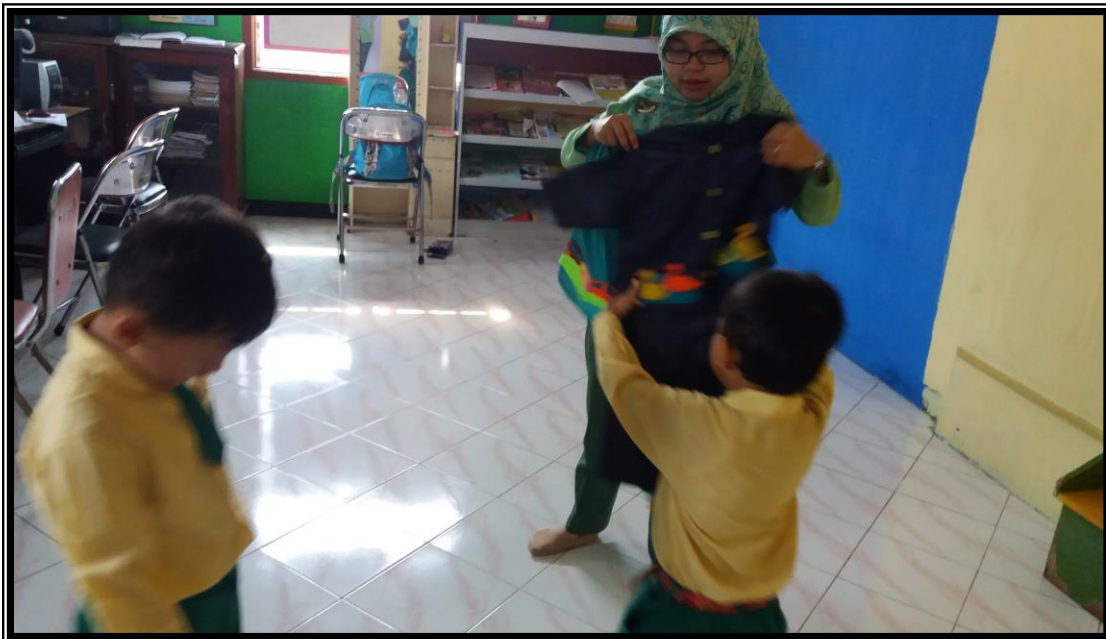
Anak Menangis saat kegiatan berlangsung