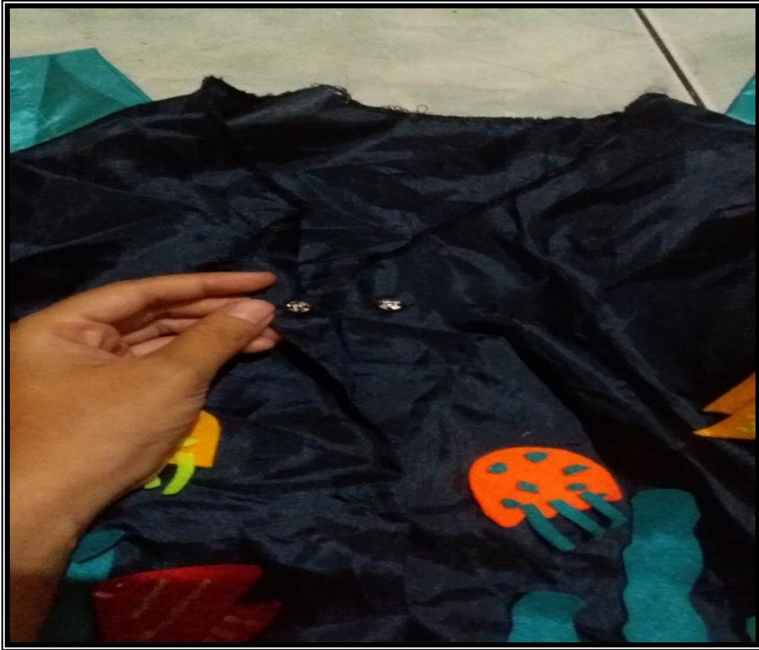
Kancing Baju Berukuran Besar