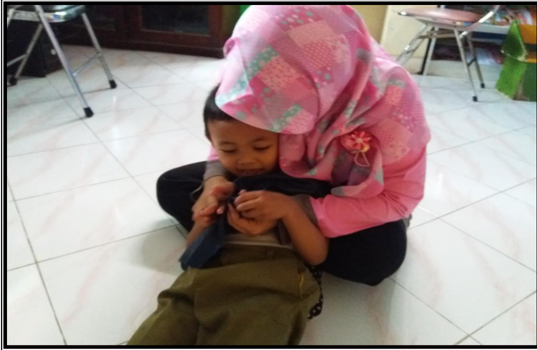
Anak menangis saat kegiatan