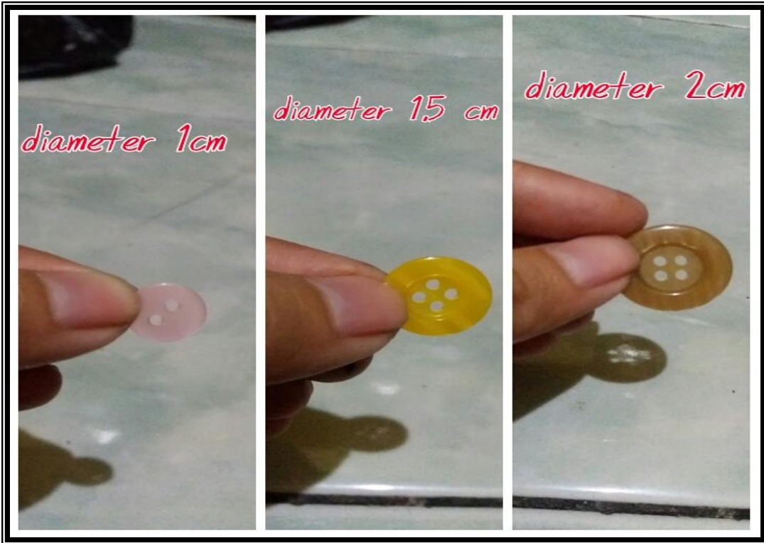
Kancing Baju Cetek