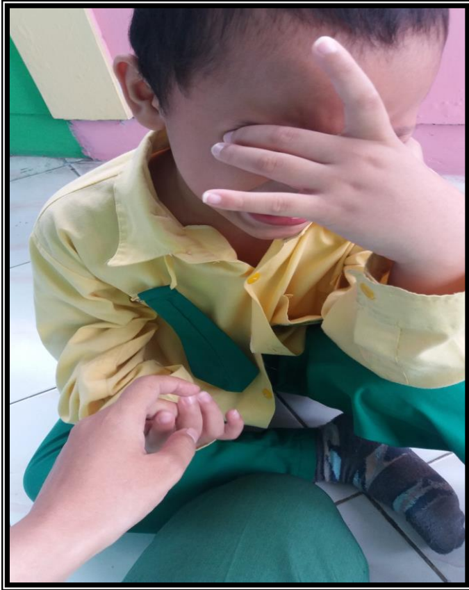
Keadaan saat kegiatan berlangsung