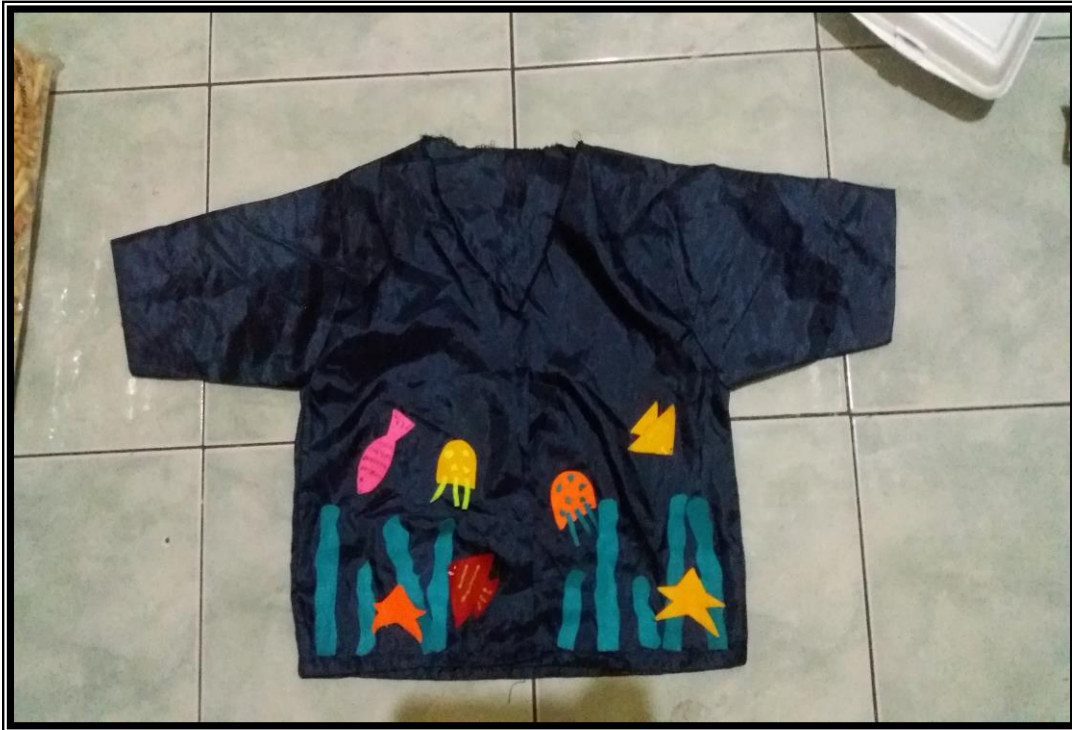
Kancing Baju Berukuran Kecil