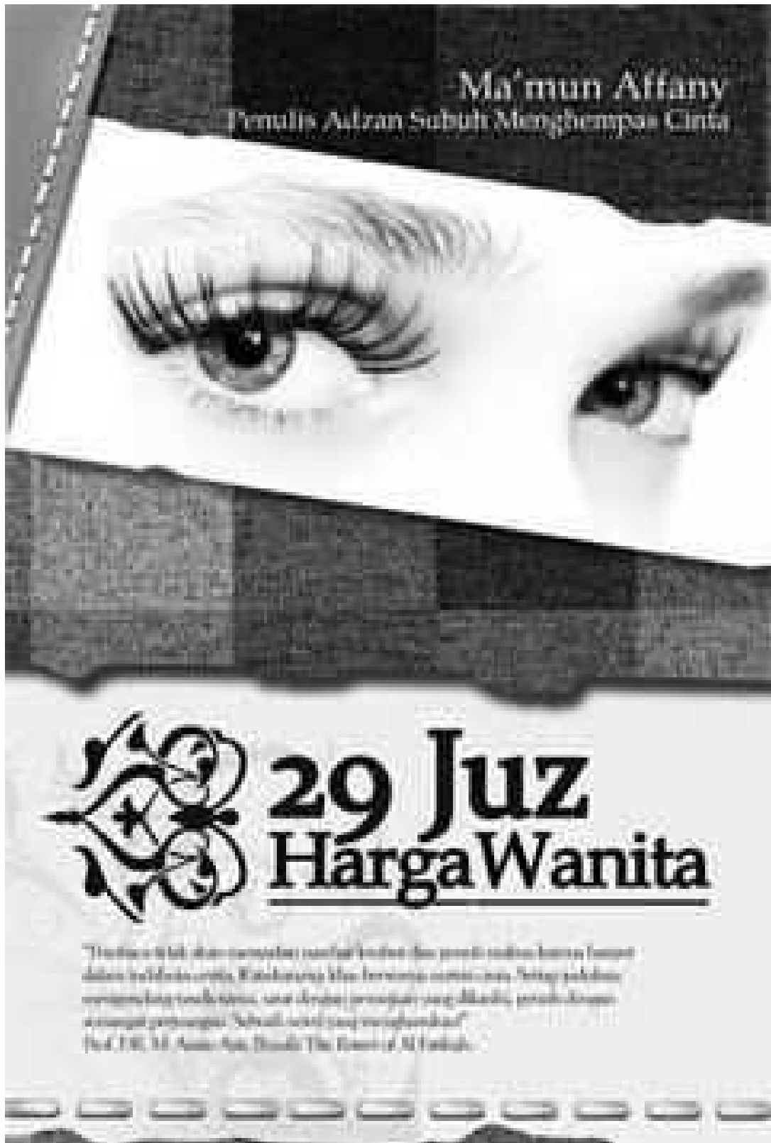
COVER NOVEL DAN TANDATANGAN PENULIS