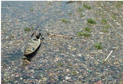
Sampah di Sungai Citarum, Jawa Barat

Republika.co.id, Bandung, 29/6/2012. Lagi, persoalan limbah industri tekstil pada sungai Citarum mendapat kecaman dari sejumlah pihak. Limbah industri yang langsung dibuang ke aliran sungai tanpa proses instalasi pengolahan limbah mengancam puluhan hektar sawah, penyakit kulit, hingga penurunan kuantitas listrik pada waduk sepanjang sungai Citarum.