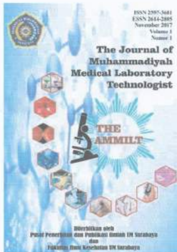
The Journal of Muhammadiyah Medical Laboratory Technologist