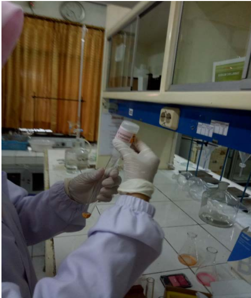
Gambar 5. Ditambahkan Pereaksi I, Pereaksi II, Pereaksi III Rhodamin B