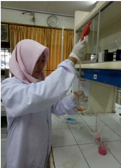
Gambar 3. Setelah ditimbang sebanyak 5gr, tambahkan 40 ml aquadest