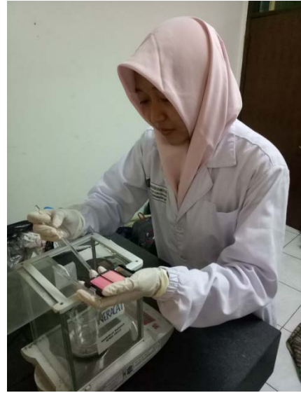
Gambar 2. Proses Penimbangan