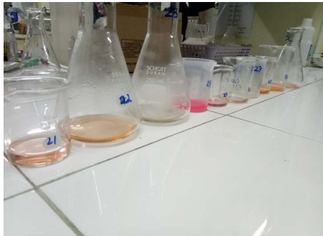
Gambar 4. Setelah disaring, diambil supernatan 1 ml