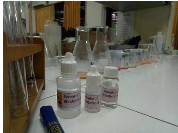
Gambar 8. Pereaksi Kit Rhodamin B