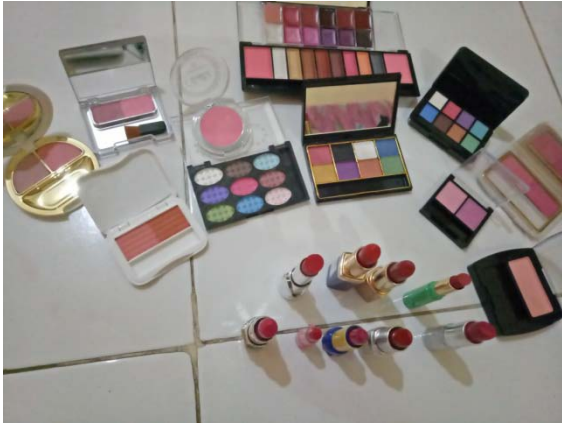
Gambar 1. Beberapa Jenis Kosmetika