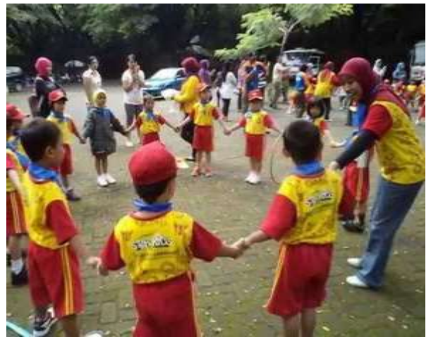
Gambar 1. Kegiatan Pembelajaran TK melati ceria school Surabaya

saja sambil ada bimbingan dari seorang guru yang mendampingi.