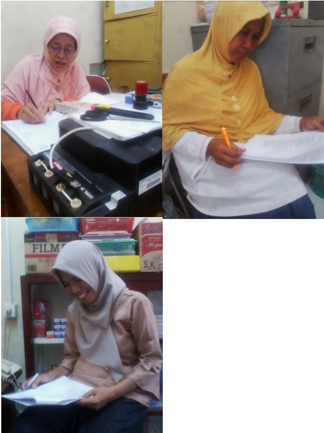
Foto bersama pengurus koperasi Karyawabn dan Dosen Universitas Muhammadiyah Suarabaya saat melaksanakan wawancara.