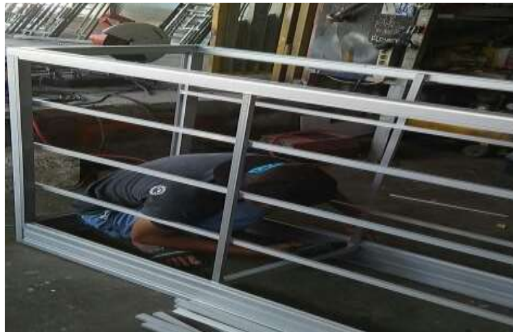
11. GAMBAR KARYAWAN MEMOTONG HOLLOW