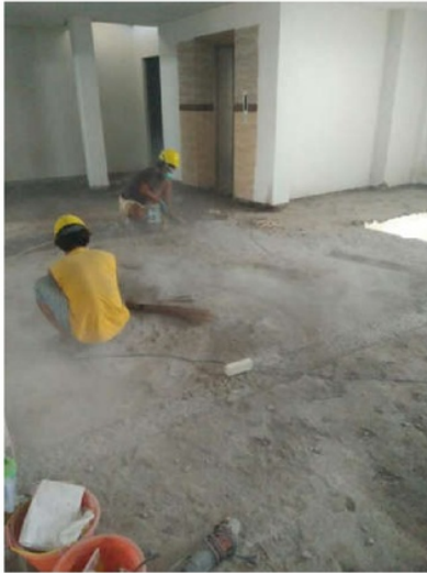
Gambar 1: pengupasan lantai keramik dan perataan lantai beton

Langkah-langkah yang dilakukan di site diperlihatkan pada gambar 1, 2 dan 3.