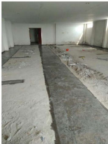
Gambar 2: pelapisan FRP dengan polyester.