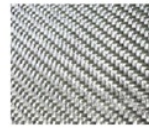
Gambar 1: Kyoto Carbon Fiber WR167

Jenis carbon dari jepang dan china pada gambar 1 dan2