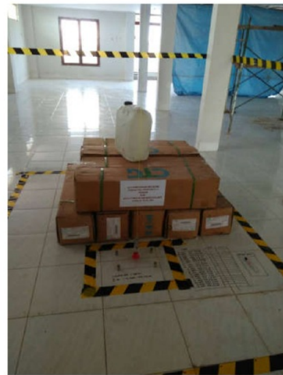
Gambar4: uji beban manual dengan bahan paking FRP seberat 400 kg.