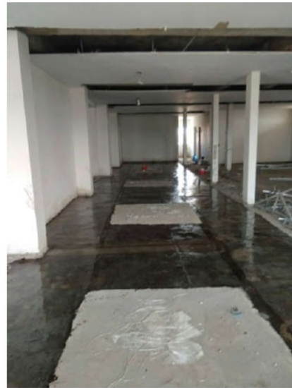
Gambar3: pelapisan daerah plat tumpuan sudah selesai.