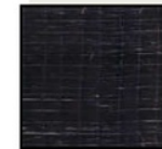
Gambar 2: Shandong Fiberglass WR600

Studi Kekuatan Momen..../Bambang K./hal. 53 -61