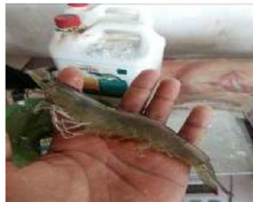
Gambar 1. Udang Vannamei

Hasil dari penggunaan strategi pembesaran udang vannamei tersebut, petani tambak udang desa Noreh selalu menjaga kepercayaan dari pelanggan. Petani tambak udang desa Noreh juga mengontrol dan mendokumentasikannya terlebih dahulu dalam setiap proses penebaran benur, pembesaran hingga panen dan memperlihatkannya kepada pelanggan terlebih dahulu. Produk udang vannamei hasil panen dapat dilihat pada gambar dibawah ini.