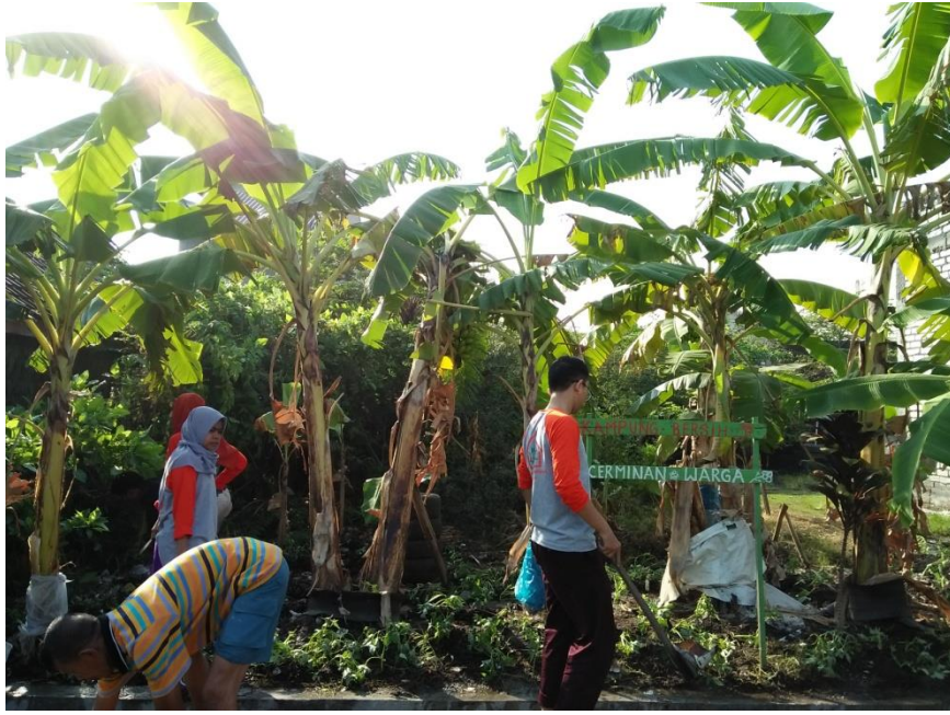
PENANAMAN TOGA DI RT 08