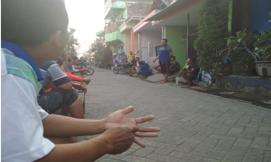
KERJA BAKTI DI RT 09