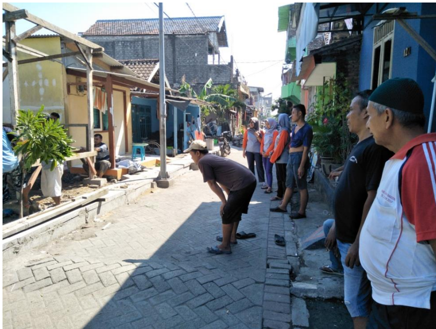
PEMBUATAN POS RONDA DI RT 09