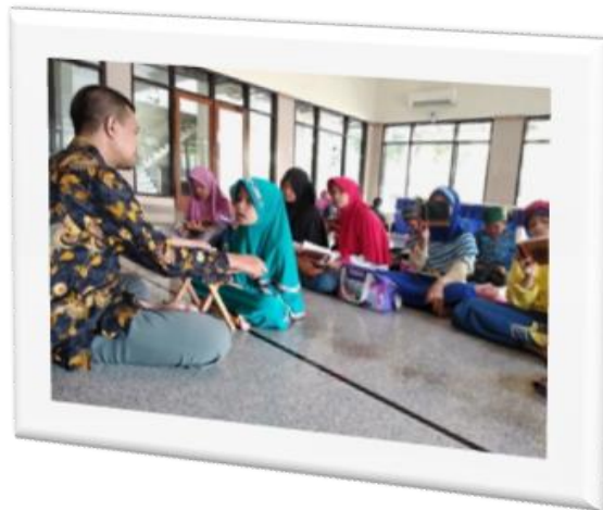
Gambar 4.7 Hafalan Individual

Peserta didik maju satu persatu menghadap ustadz-ustadzah.