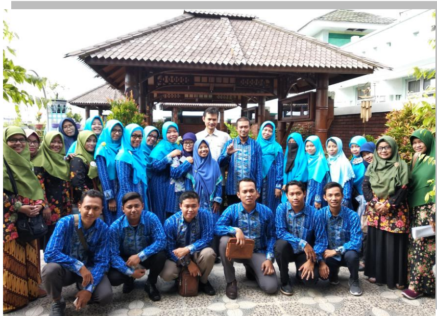
Gambar 4.5 Dewan Guru dan Ikatan Wali Murid