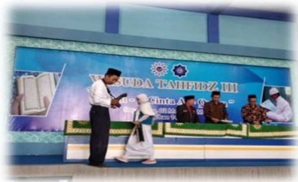
Gambar 4.12 Wisuda Akbar Tahfidz III, Tahun 2019 di Perguruan Muhammadiyah Taman, Sidoarjo