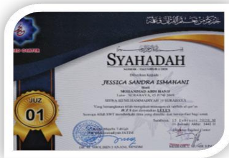
Gambar 4.14 Syahadah Juz 30, 29, dan 1 Wisuda Akbar Tahfidz IV (Virtual), Sabtu, 7 Maret 2020 oleh Tim Tajdied, Majelis Tabligh PWM Jawa Timur