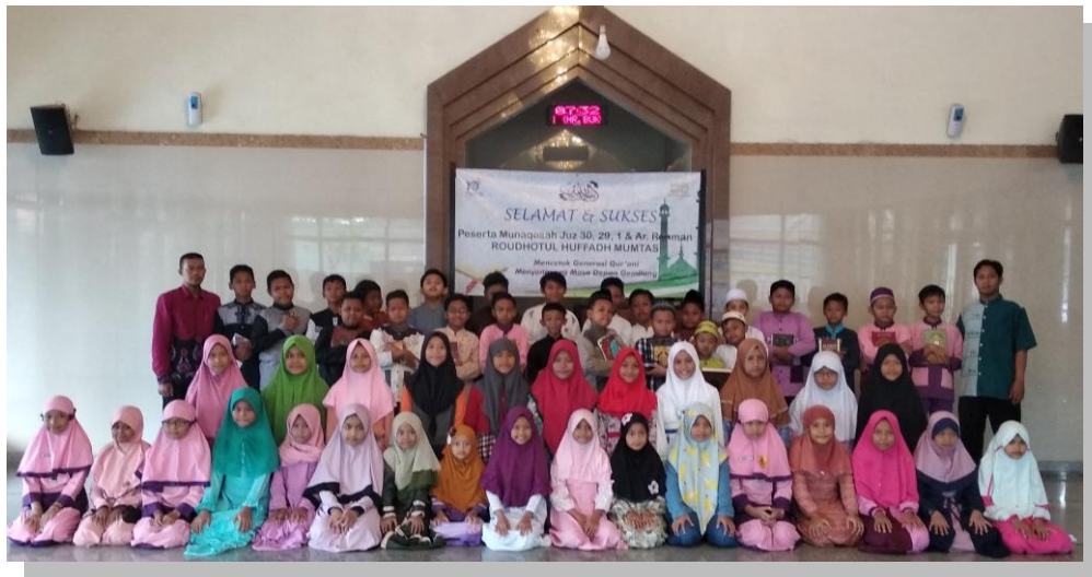
Gambar 4.10 Peserta Munaqosah Tahun 2020