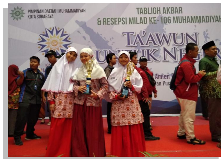
Gambar 4.17 Juara II Tahfidz Beregu dan Juara III Qiro'ah Pada Milad Muhammadiyah ke-106 Tahun 2018 di Islamic Center Surabaya

Atiqoh Juara 3 Tahfidzul Quran Juz 30, Kompetisi Anak Sholeh 2019, Se-Gerbangkertasusila yang diadakan oleh SMP Muhammadiyah 5 Pucang.