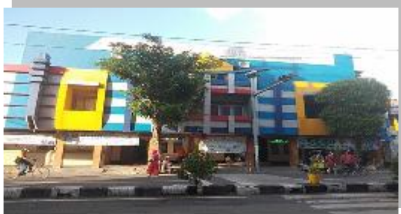
Gambar 4.1 Gedung Perguruan Muhammadiyah Kapasan, Kampus Awal SD Muhammadiyah 10 Surabaya

SD Muhammadiyah 10 berdiri pada tahun 1967 yang awal berdiri berlokasi di Jln. Kapasan 73 - 75, yang dulunya merupakan kampung picinan dan terletak disalah satu pusat bisnis kota Surabaya, yaitu Pasar Kapasan. Walaupun demikian disekitar lingkungan tersebut juga banyak terdapat perkampungan warga lokal, baik madura, jawa, dan juga komunitas Arab. Mengingat dilingkungan tersebut masih belum ada sekolah yang bercirikan agama dan menjadi kebutuhan masyarakat akan adanya sekolah agamis, maka aktifis Persyarikatan Muhammadiyah berinisiatif mendirikan SD Muhammadiyah 10. Secara umum peserta didik yang bersekolah dilembaga ini didominasi oleh masyarakat pedagang dan pekerja atau