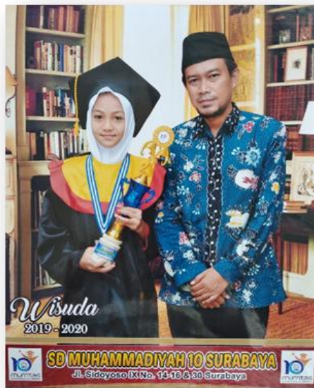
Gambar 4.13 Wisuda Akbar Tahfidz IV (Virtual), Sabtu, 7 Maret 2020