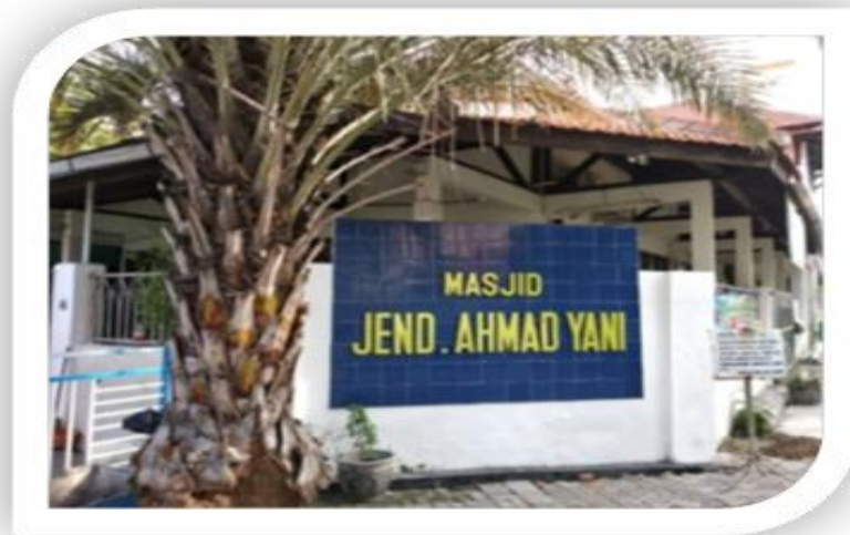
Gambar 4.9 Masjid Jenderal Ahmad Yani

Sarana olah raga, kerja sama dengan pihak luar, dan kelas tadarus daily sebanyak 18 kelas yang dibagi menurut kemampuan masing-masing anak, sebagian kelas berada di masjid.