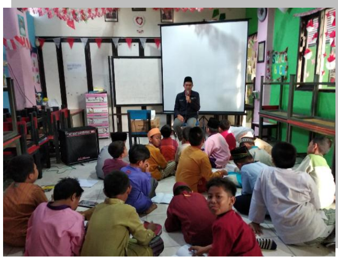
Gambar 4.6 Hafalan Klasikal