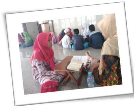
Gambar 4.8 Program Tahfidh Camp In Holiday