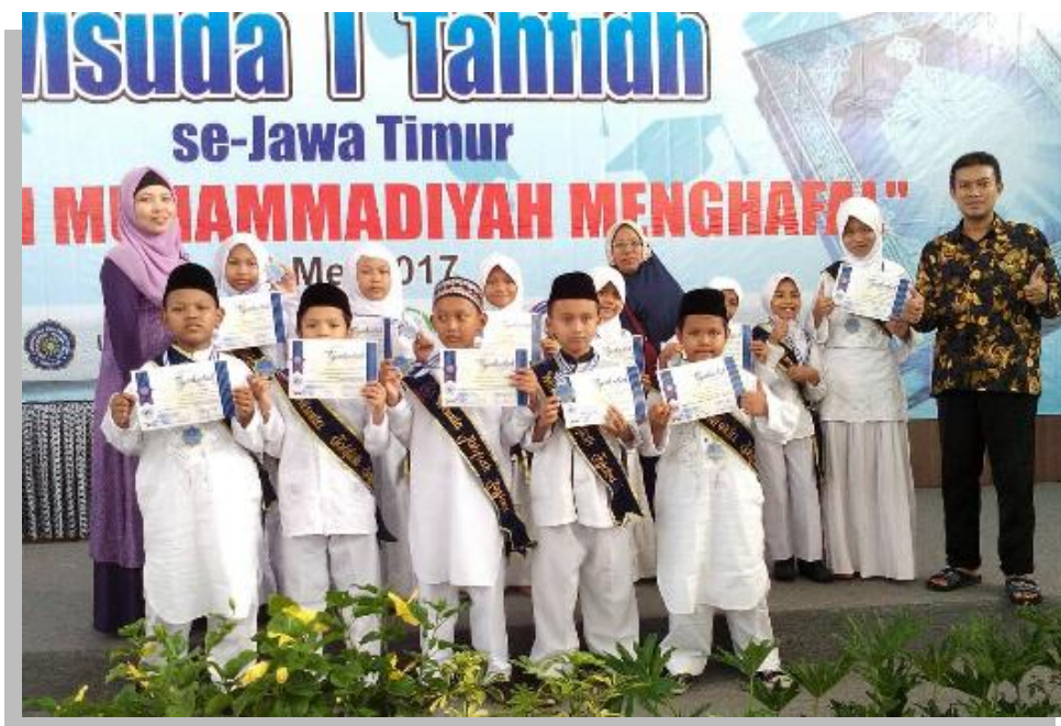
Gambar 4.11 Wisuda Akbar Tahfidh I, Tahun 2017 Se-Jawa Timur di Universitas Muhammadiyah Gresik