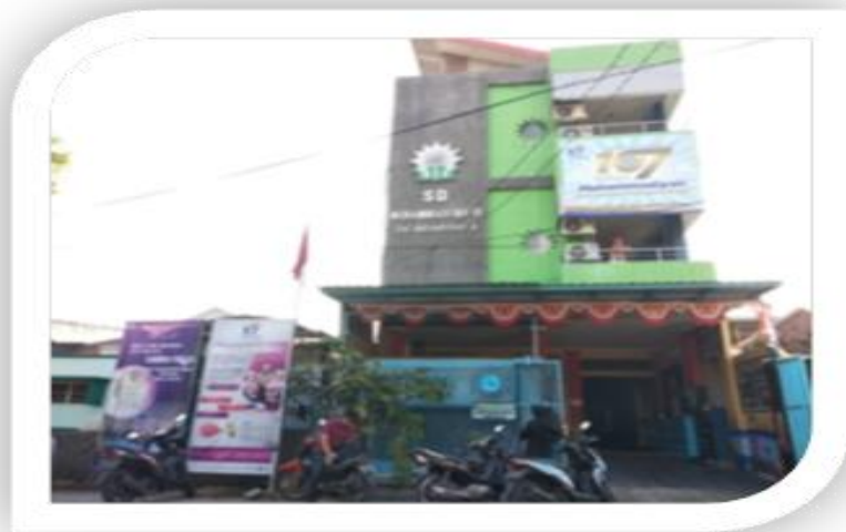
Gambar 4.2 Gedung Baru SD Muhammadiyah 10 Surabaya

Secara geografis, SD Muhammadiyah 10 terletak di wilayah Surabaya utara, Kecamatan Simokerto. Secara resmi (dengan Izin Operasional Penyelenggaraan Sekolah Swasta dari Dinas Pendidikan Kota Surabaya, dengan Nomor : 188/2116/436.7.1/2018) terletak dialamat : Kampus I : Jln. Sidoyoso 9/14 – 16 dan Kampus II : Jln. Sidoyoso 9/30.