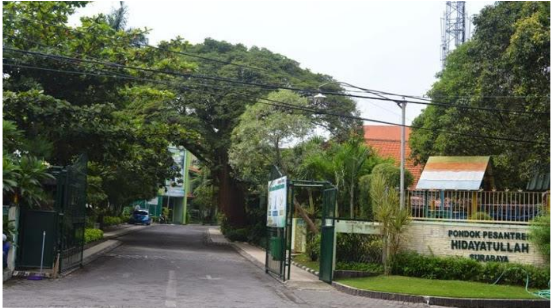
Gambar 1.1 Lingkunga pondok pesantren Hidayatullah