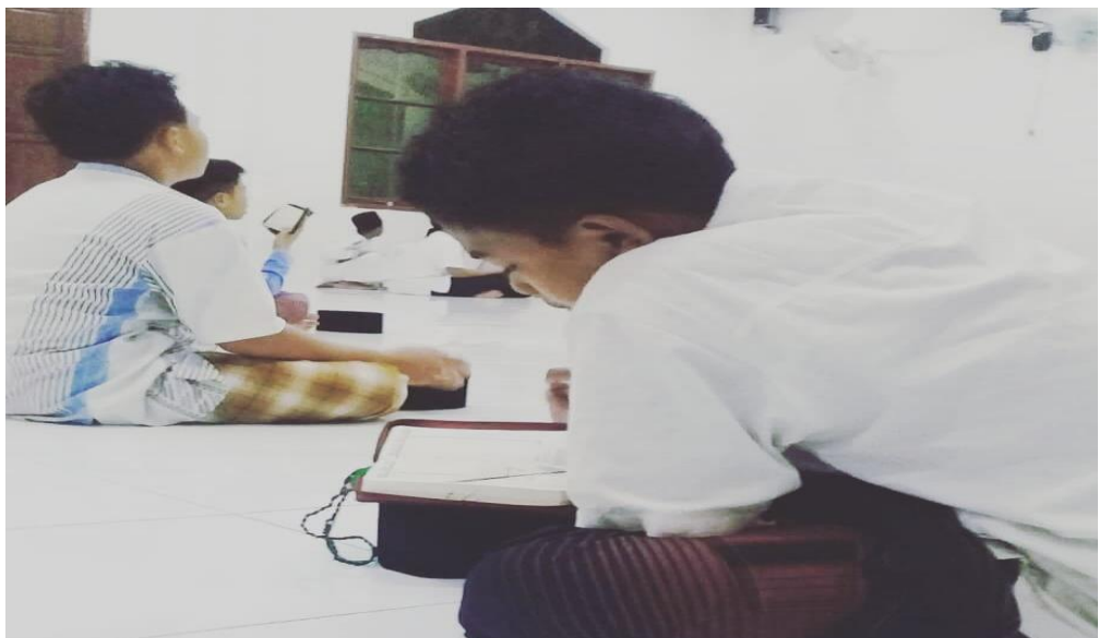
Gambar 1.2 Siswa sedang menghafal al-qur'an