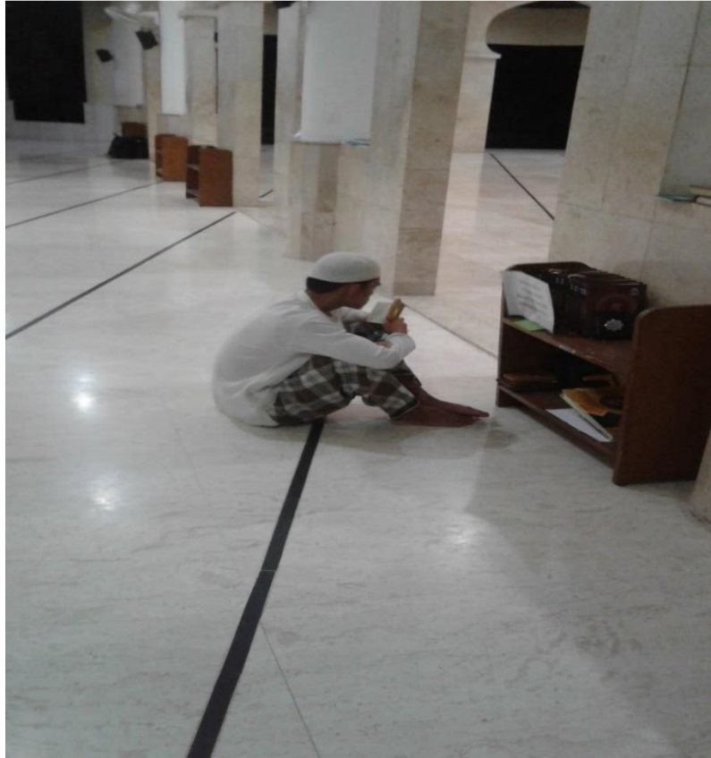
Gambar 1.5 Siswa sedang menghafal al-qur'an sendirian.