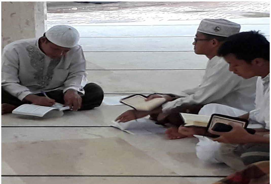
Gambar 1.4 Suasana saat setor hafalan di Mesjid