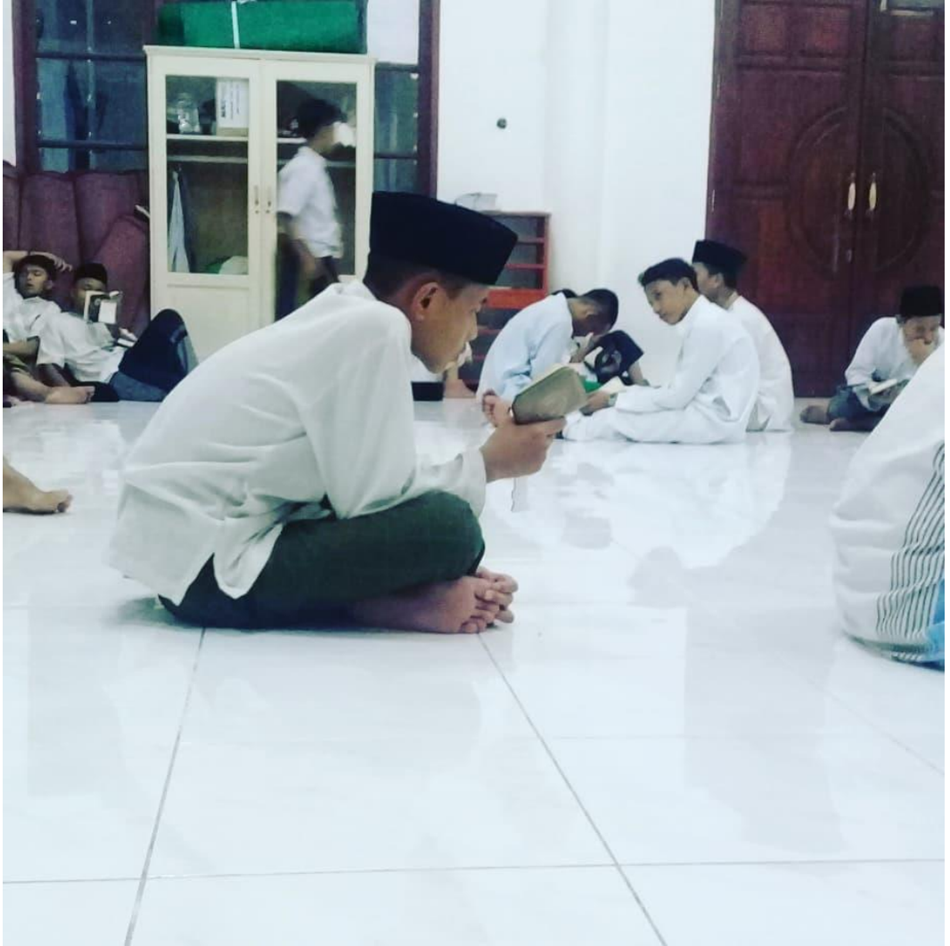
Gambar 1.6 Siswa sedang hafalan