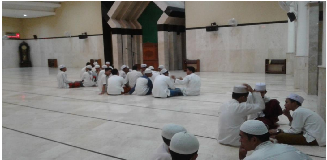
Gambar 1.3 Siswa gabungan SMP dan SMA Hidayatullah luqman al-hakim membuat halaqah