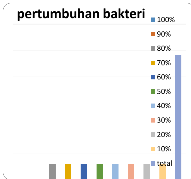
Gambar 1. Pertumbuhan Escherichia coli pada media EMB

Negatif (-) : Tidak terjadi pertumbuhan bakteri