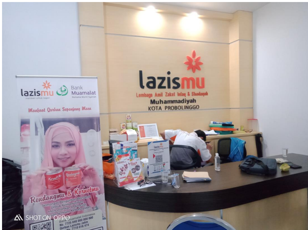
KANTOR LAZISMU KOTA PROBLINGGO