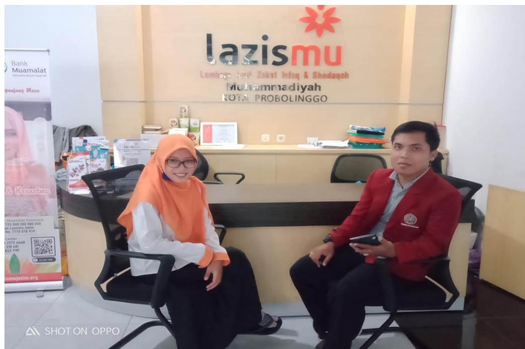
FOTO SAAT WAWANCARA