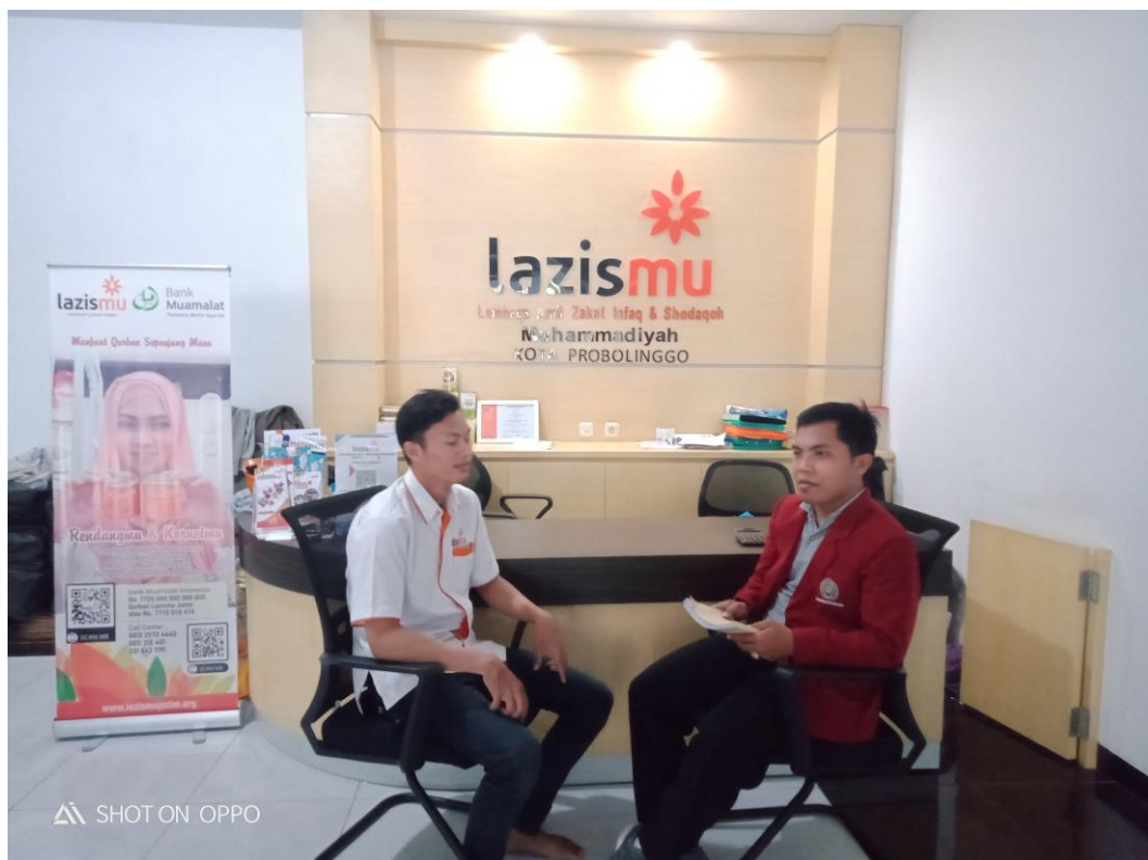
FOTO SAAT WAWANCARA