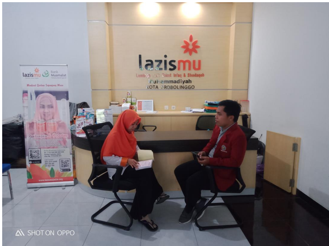
FOTO SAAT WAWANCARA