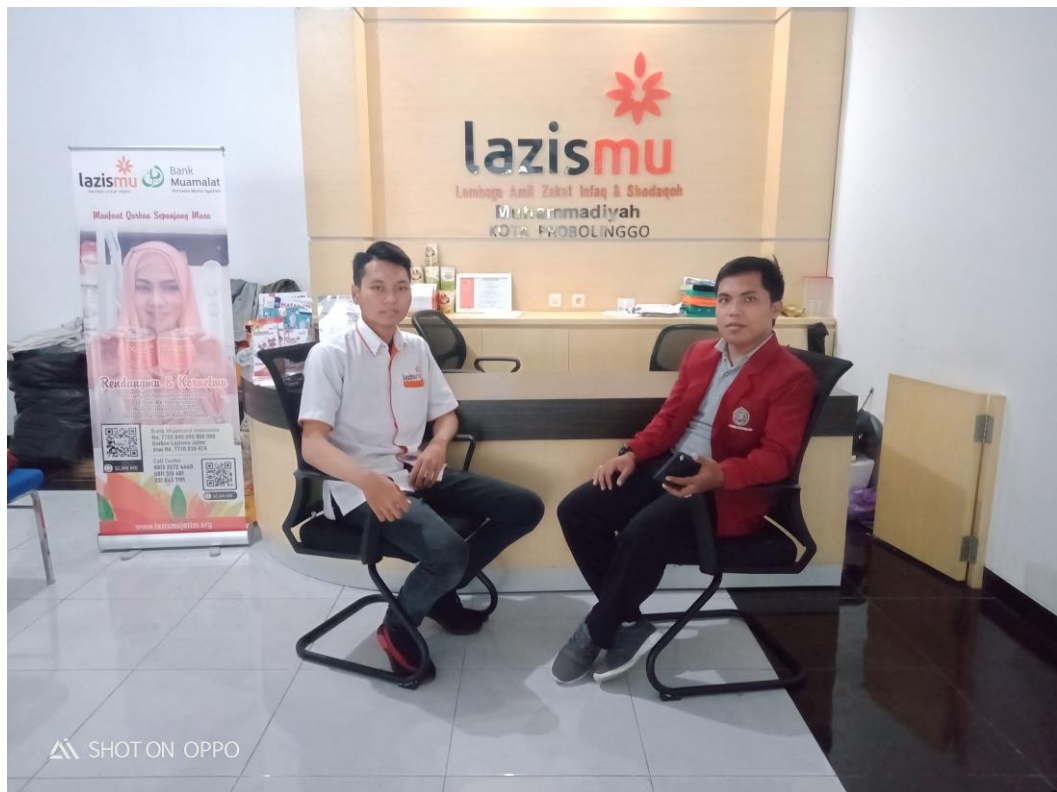
FOTO SAAT WAWANCARA