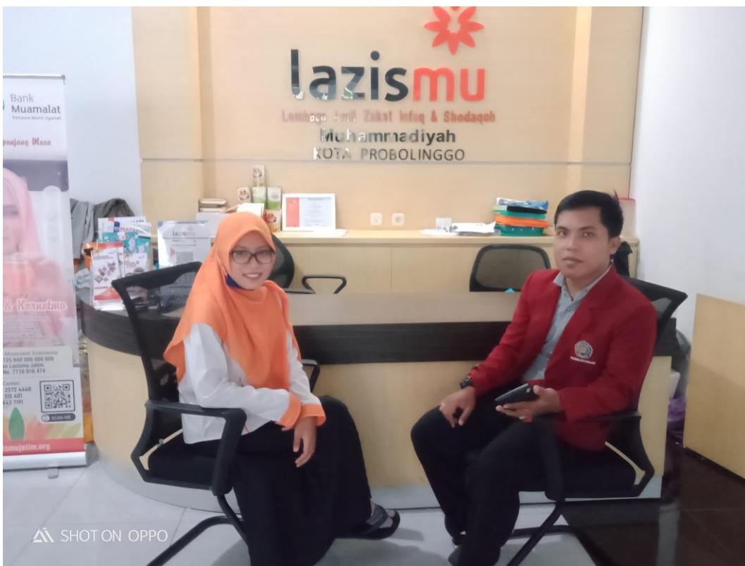
FOTO SAAT WAWANCARA