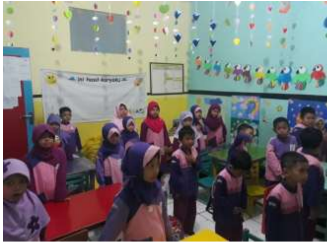
Gambar 1. Pembelajaran anak melakukan gerak dan lagu sholat guna meningkatkan kecerdasan emosional anak