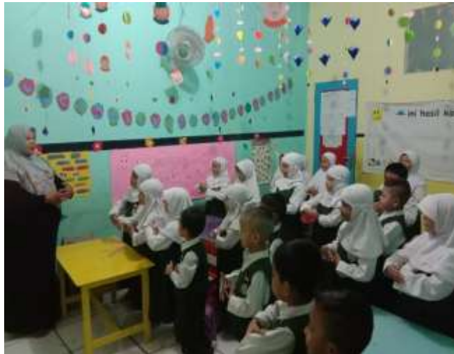
Gambar 1. Guru dan murid sedang melakukan gerak dan lagu ampar-ampar pisang secara bersama-sama. Guna meningkatkan kecerdasan emosional anak