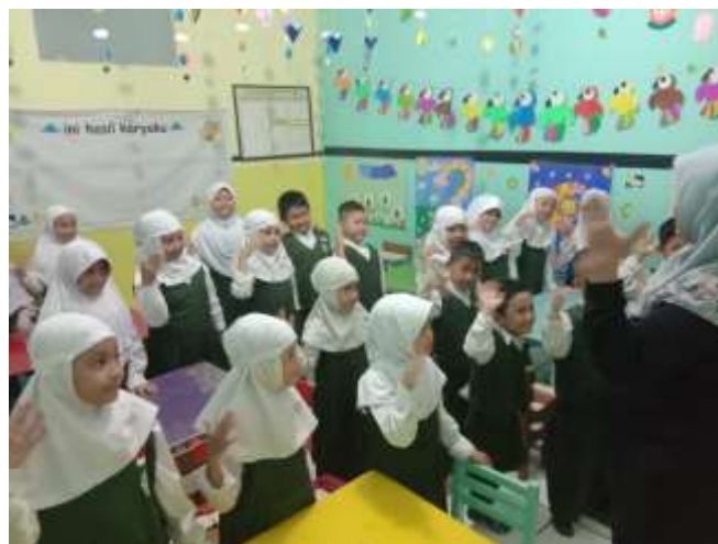
Gambar 2. Guru dan murid sedang melakukan gerak dan lagu suka buah secara bersama-sama. Guna meningkatkan kecerdasan emosional anak