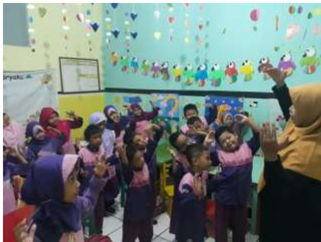
Gambar 2. Pembelajaran anak melakukan gerak dan lagu rukun islam guna meningkatkan kecerdasan emosional anak