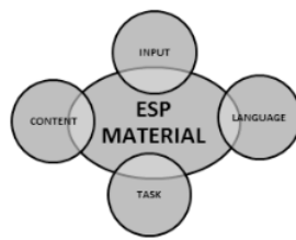
Figur. 3.2 Model atau struktur materi

Kontekstual realisasi dari materi adalah rancangan ( draft ) dari materi yang akan di kembangkan. Model yang digunakan adalah model dari Hutchinson & Alan, (1987). Model ini terdiri dari empat bagian; 1. masukan -input ; 2. fokus konten- focus content ; 3. fokus bahasa- language focus dan; 4. latihan- task .