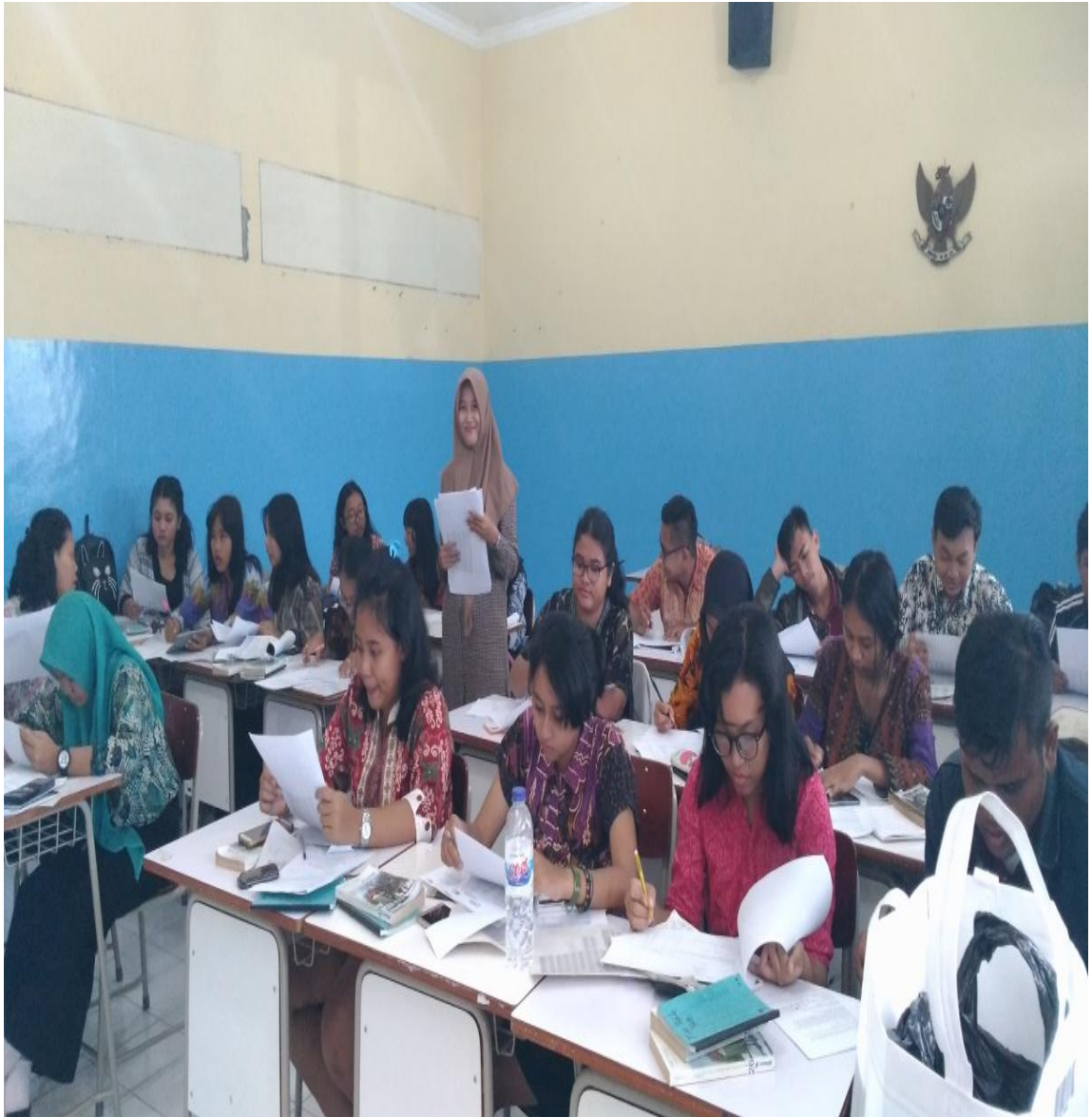
GAMBAR 2. SUASANA MENERJAKAN ANGKET DENGAN SISWA KELAS XII USAHA PERJALANAN WISATA 2 DI KELAS.