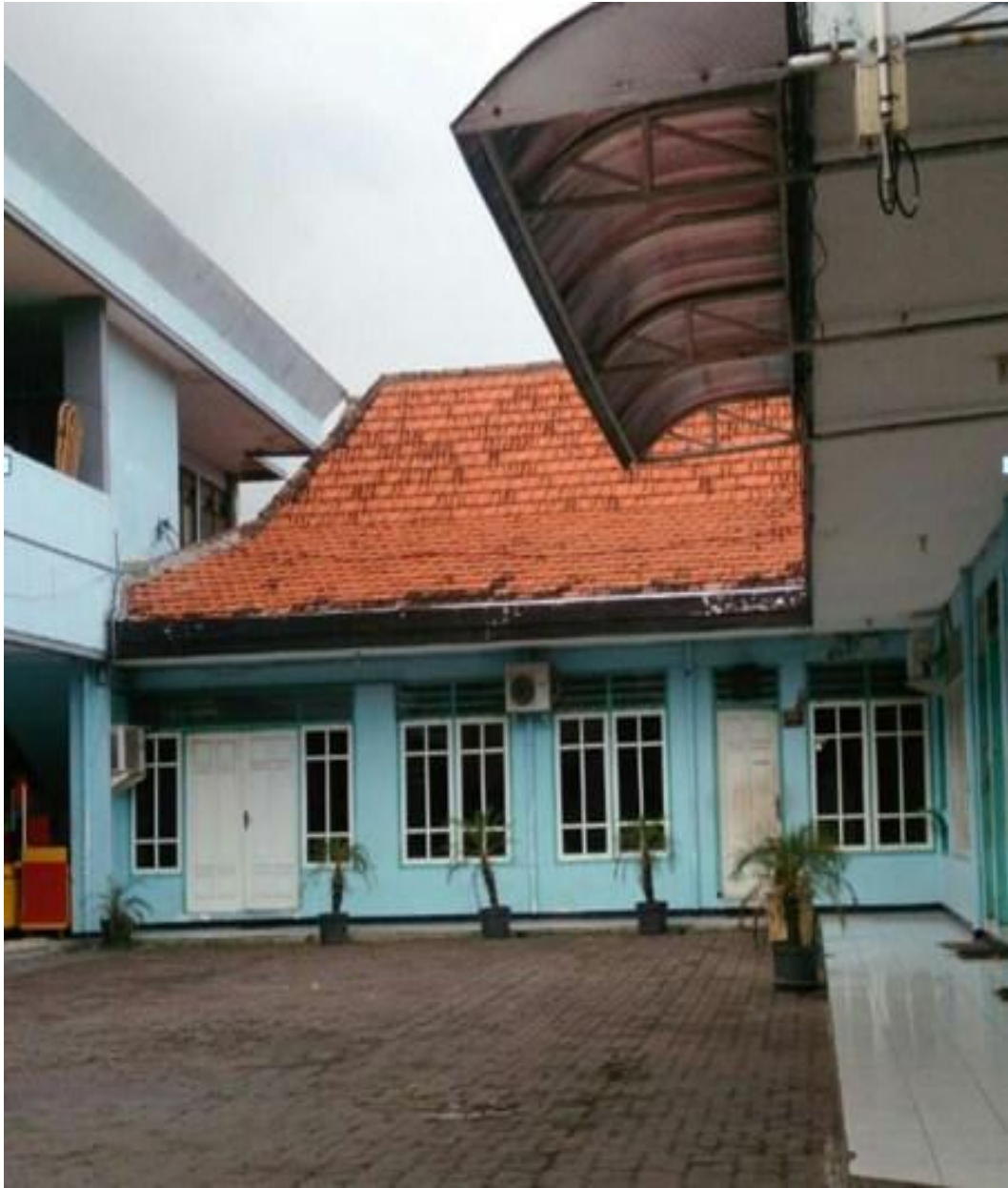
GAMBAR 6. SMK SATYA WIDYA TAMPAK DARI DALAM