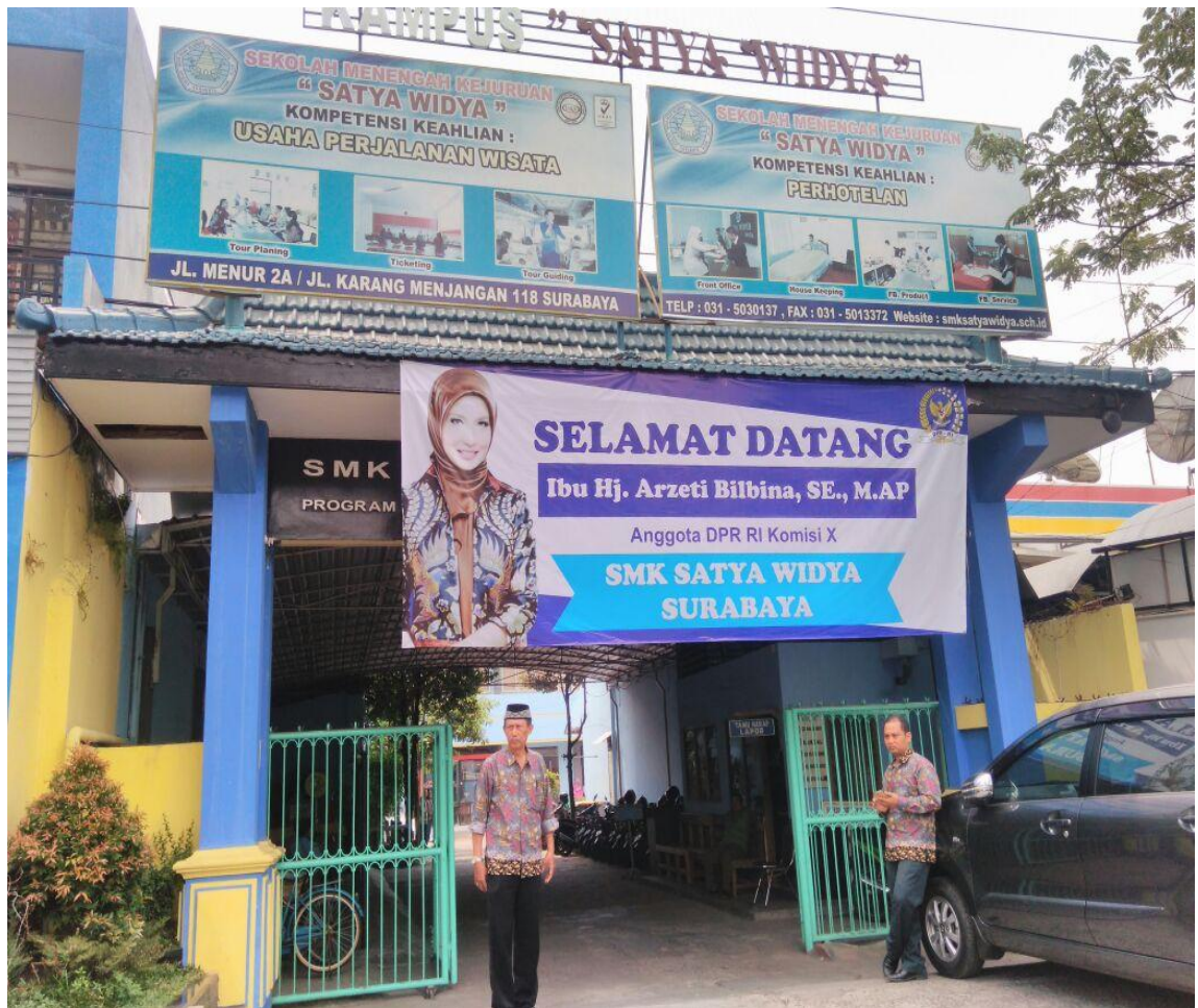
GAMBAR 5. SMK SATYA WIDYA TAMPAK DEPAN