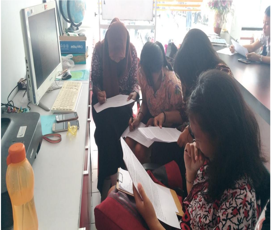
GAMBAR 1. SUASANA MENERJAKAN ANGKET DI LABORATORIUM PARIWISATA.