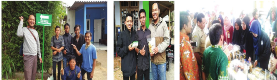
Gambar 2: Pemanfaatan Produk Olahan Susu serta Pengembangan Edu-Wisata Milky Village bersama warga Desa Jarak, Kec. Wonosalam, Kab. Jombang