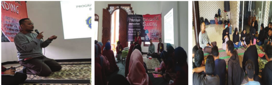
Gambar 1: Sosialisasi Pendampingan hukum bagi UMKM bersama warga Desa Jarak, Kec.Wonosalam, Kab.Jombang

hukum, seperti: perizinan legalitas UMKM berupa: Tanda Daftar Perusahaan (TDP), Surat Izin Usaha Perdagangan (SIUP), Nomor Pokok Wajib Pajak (NPWP), Izin Gangguan, serta Izin Produk Industri Rumah Tangga (P-IRT), dan hal tersebut menjadi perhatian untuk penjualan komoditas barang maupun jasa dalam e-commerce yang secara hukum juga berpotensi dipersyaratkan, sehingga warga Desa Jarak, Kec.Wonosalam, Kab.Jombang memiliki kesadaran hukum untuk mengurus perizinan tersebut.