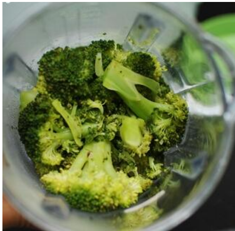
Pembuatan Jus Brokoli