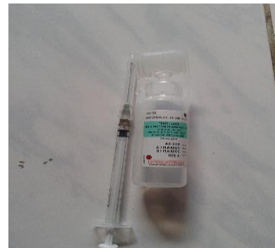
Gambar 4 Dekstroksa beserta sonde