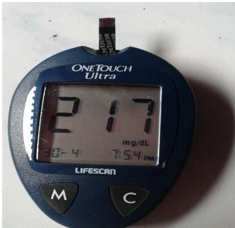
Gambar 5 Alat pemeriksaan Kadar Glukosa Darah