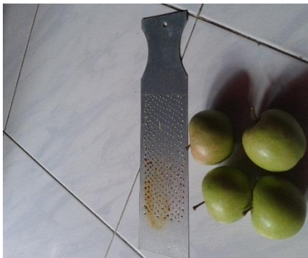
Gambar 3 Buah apel hijau beserta parutannya