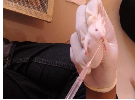
Gambar 2 Pada saat pemberian dekstroksa