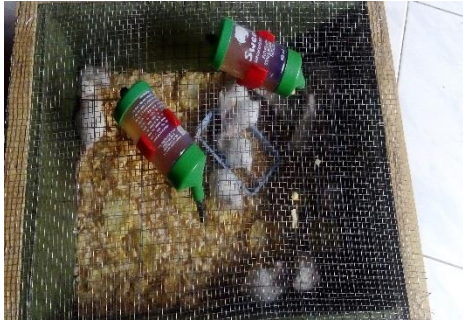
Gambar 1 Perlakuan pada mencit