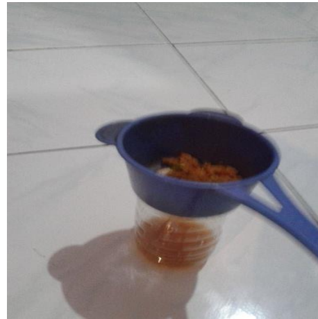
Gambar 6 Pada Saat Proses Memeras