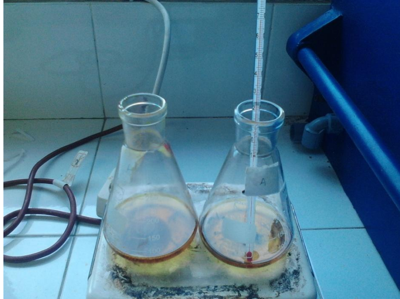
Gambar Pemanasan Minyak dengan suhu 70°C (Dokumen Pribadi, 2015)