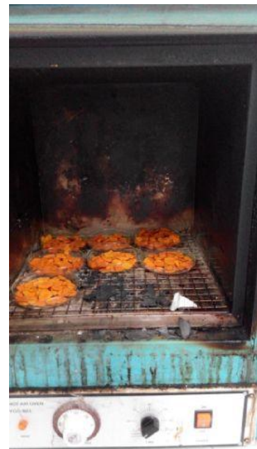
Proses Pengeringan Kunyit