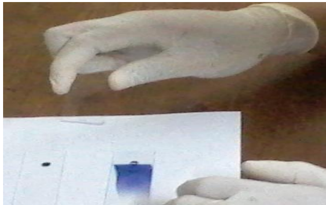
b. Gambar pembuatan preparat retikulosit