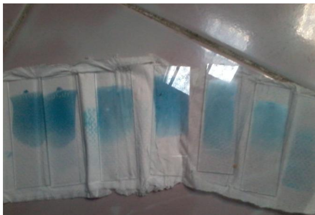
c. Gambar preparat retikulosit