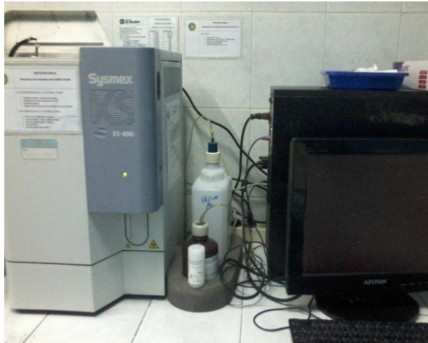
a. Gambar alat untuk pemeriksaan hemoglobin