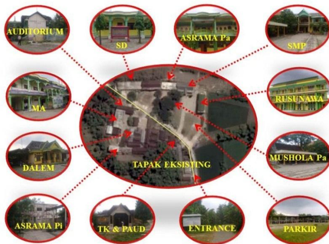
Gambar 4.3.2 Eksisting Tapak

Berdasarkan data yang diperoleh dari hasil observasi obyek, kondisi eksisting tapak obyek penataan dan pengembangan pondok pesantren ini sebagai berikut: