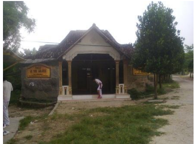
TK dan PAUD