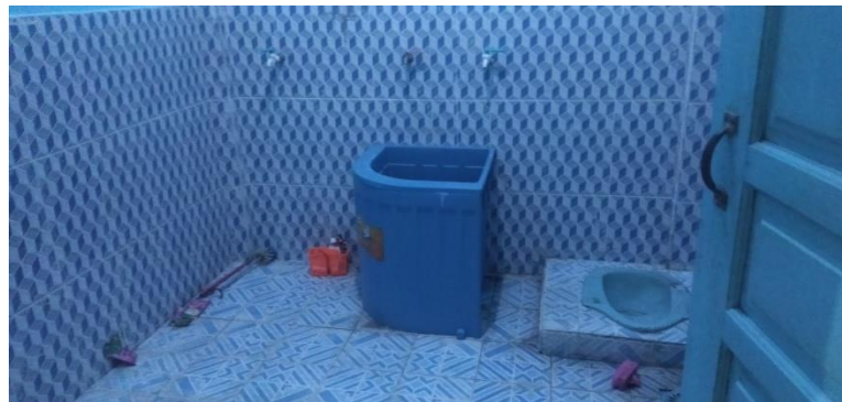
Ruang Kamar Mandi / WC Siswa