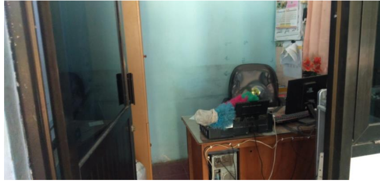
Ruang Kepala Sekolah