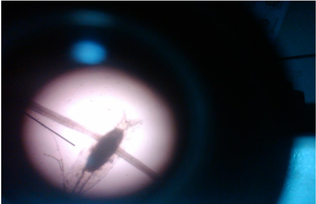
Morfologi Telur Trichuris trichiura