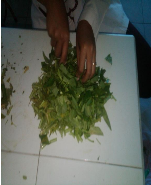
Pencacahan Sampel Kangkung