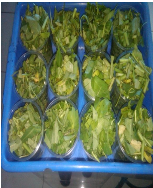
Perendaman Sampel Kangkung