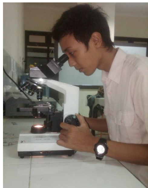
Pengamatan Sampel Kangkung