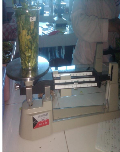
Penimbangan Sampel Kangkung