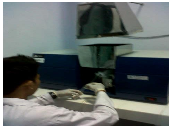
4. Pemeriksaan sampel pada alat Kromatografi Gas