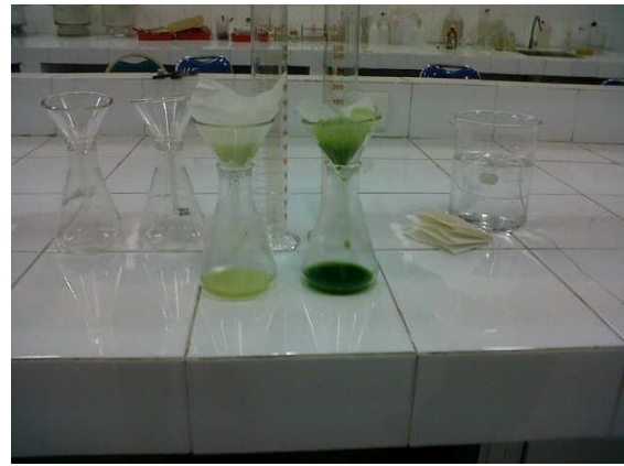
2. Sawi hijau dan sawi putih yang sudah halus dan disaring