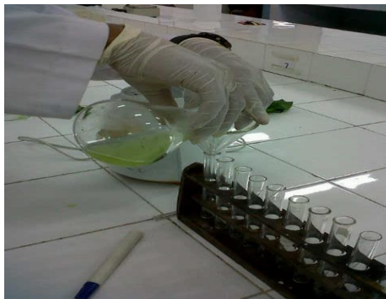
3. Sampel dimasukkan dalam tabung