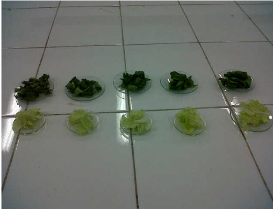
1. Sawi hijau dan sawi putih sawi