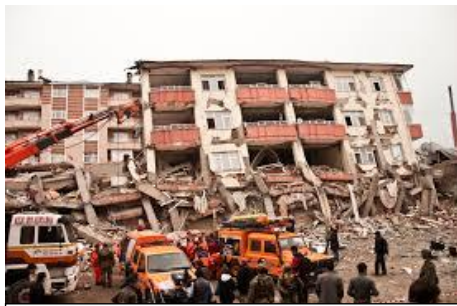
Eastern Turkey Earthquake