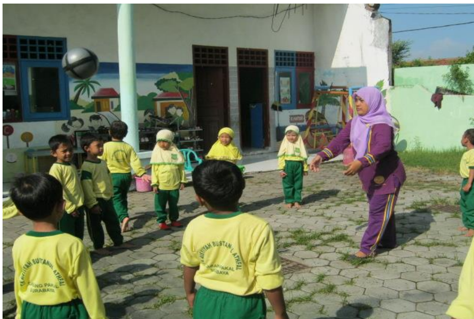
Gambar 4 Guru memberikan contoh lempar tangkap