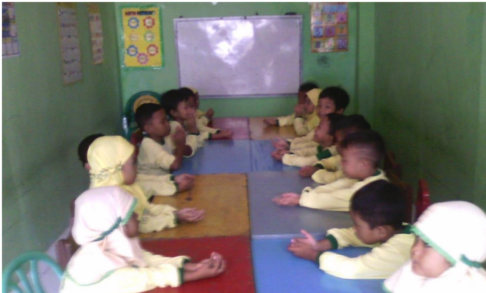
Gambar 2 Persiapan berdo'a sebelum melakukan kegiatan