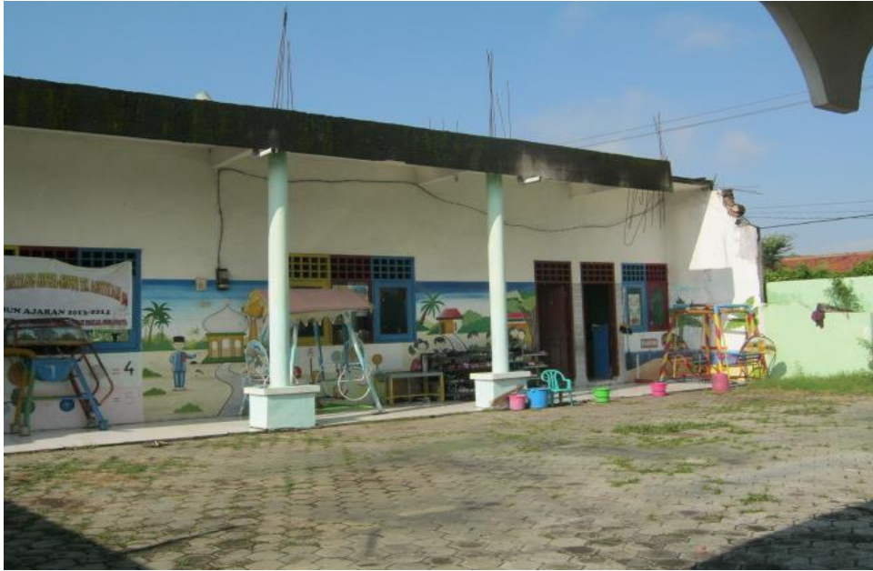
Gambar 1 Kondisi Lapangan sekolah