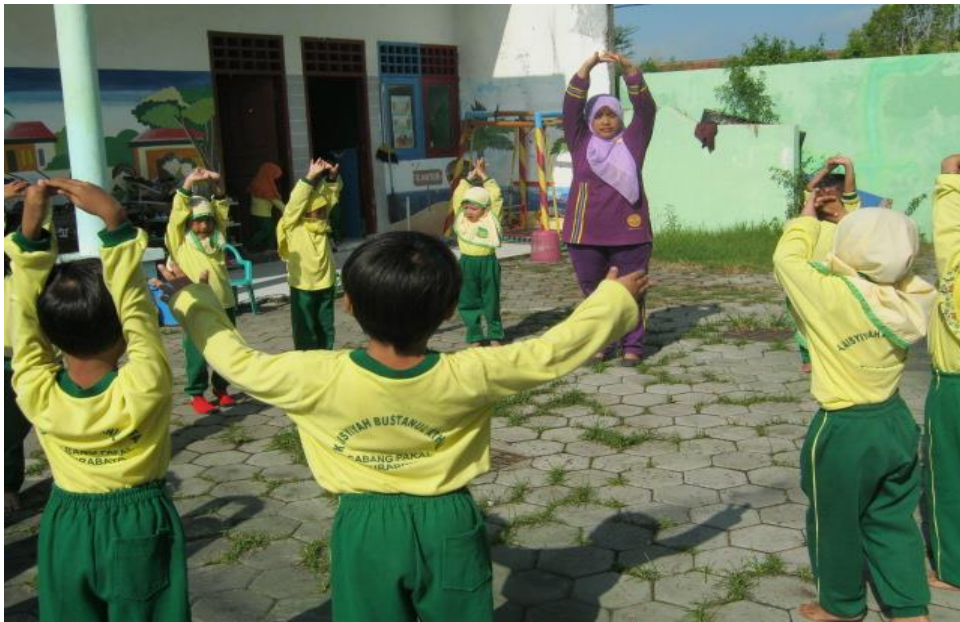
Gambar 3 Kegiatan pemanasan