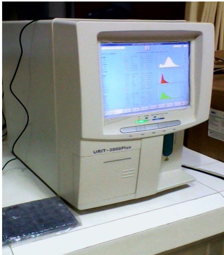
Alat Hematologi Analyzer URIT-3000 Plus