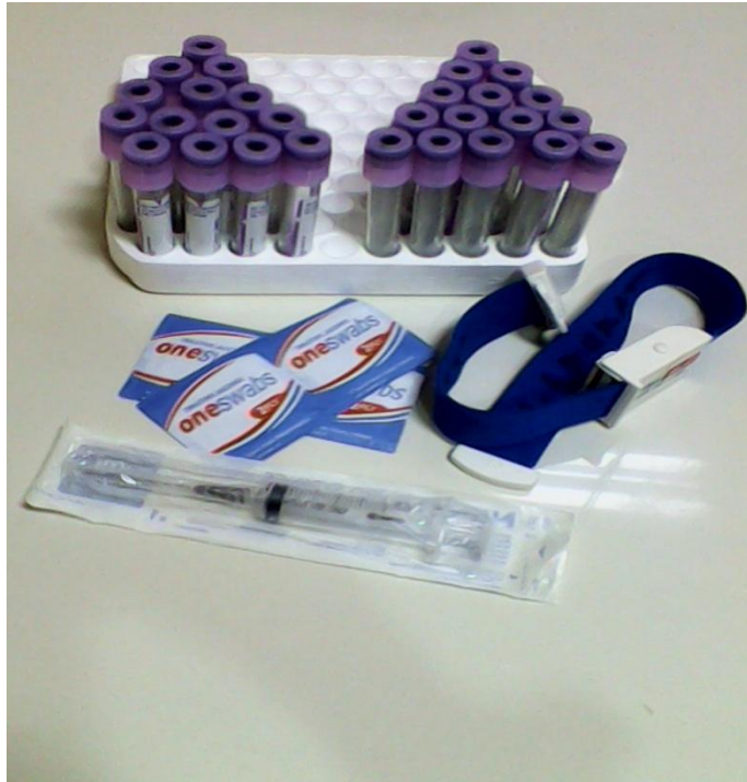
Persiapan sebelum pengambilan darah