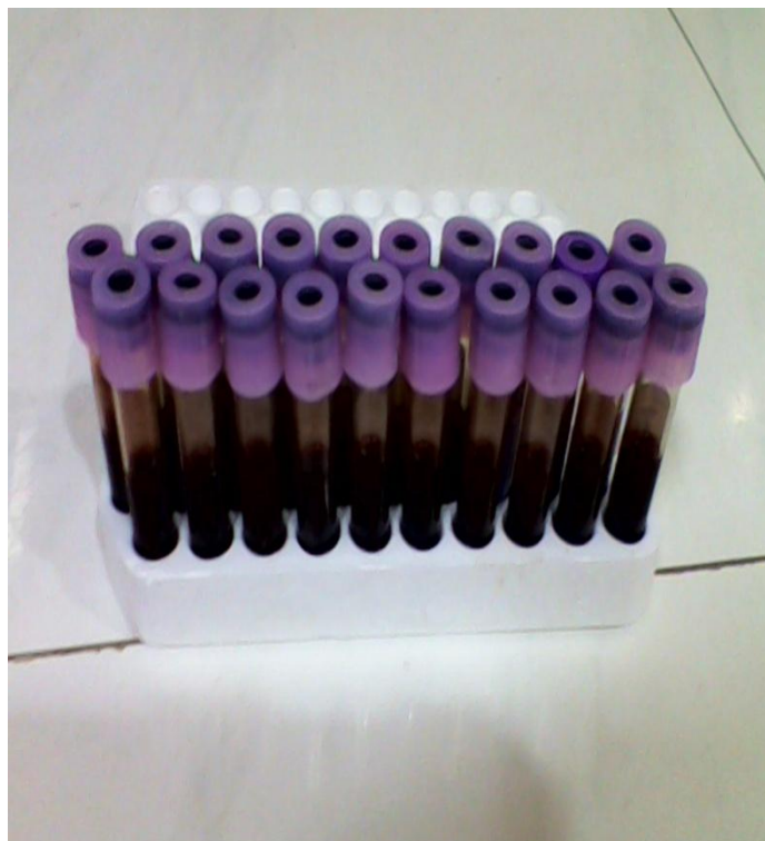
Sampel darah EDTA konvensional