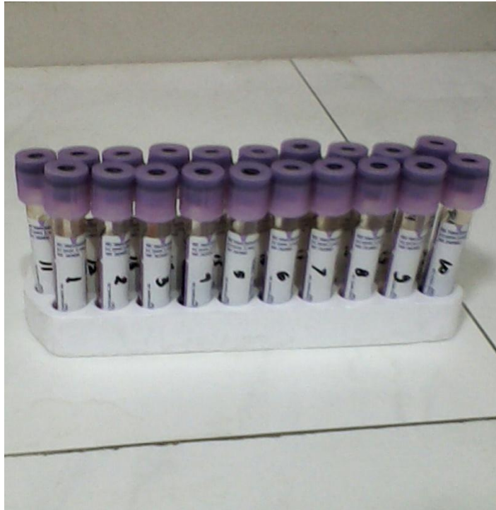
Sampel darah EDTA vacutainer