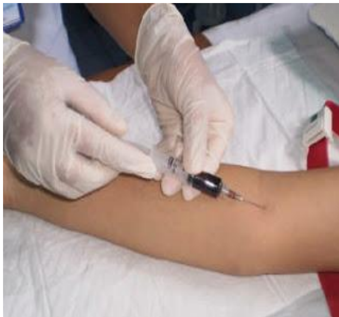
Pengambilan sampel darah