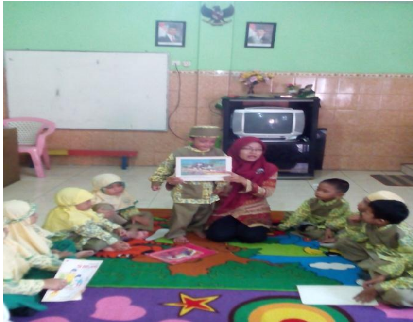
Gambar 5: Aktivitas guru membimbing anak untuk menyebutkan tokoh-tokoh dalam cerita