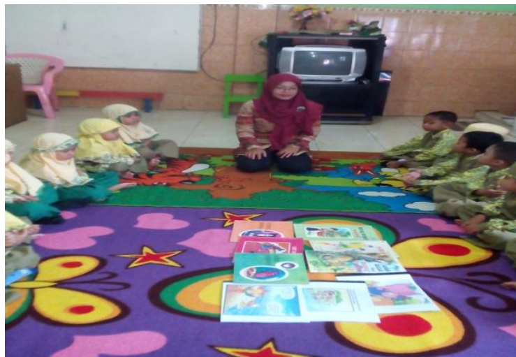
Gambar 1: CIRCLE TIME