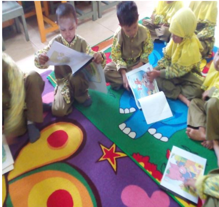
Gambar 3 : Suasana kelas saat anak berinteraksi dengan media buku cerita bergambar