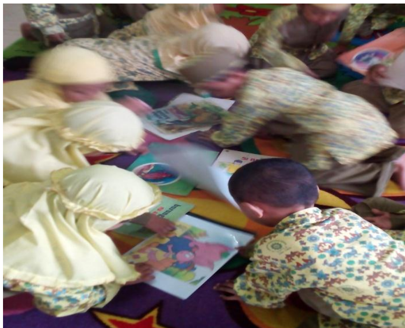
Gambar 4: Suasana kelas saat anak memilih salah satu judul buku cerita untuk dibacakan guru