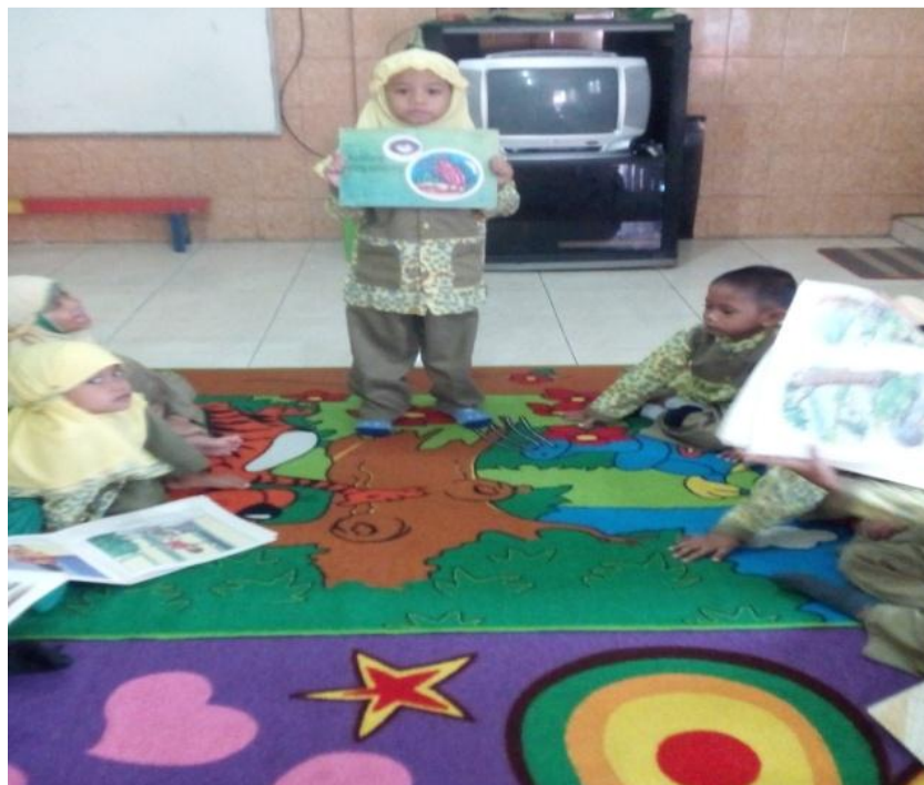
Gambar 6: Anak mencoba menceritakan buku cerita bergambar