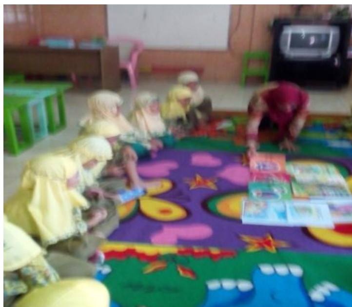
Gambar 2: Aktivitas guru menjelaskan media buku cerita bergambar