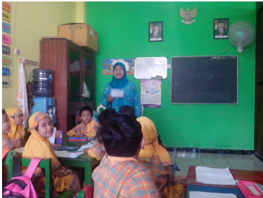
FOTO KEGIATAN MENIRU KEMBALI 4 URUTAN KATA