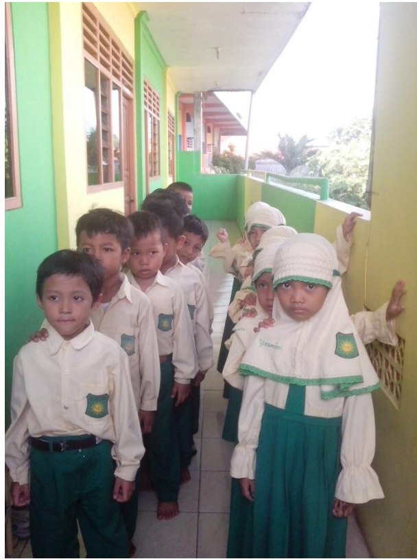
FOTO BERBARIS SEBELUM MEMULAI KEGIATAN