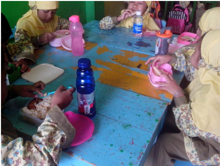
FOTO KEGIATAN MAKAN BERSAMA