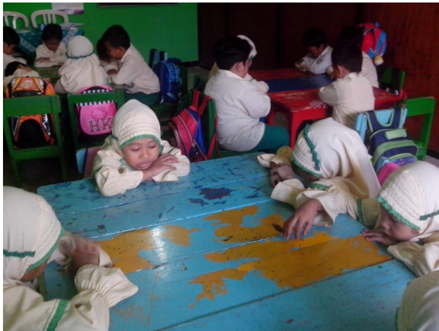
FOTO BERDO'A SEBELUM MELAKUKAN KEGIATAN