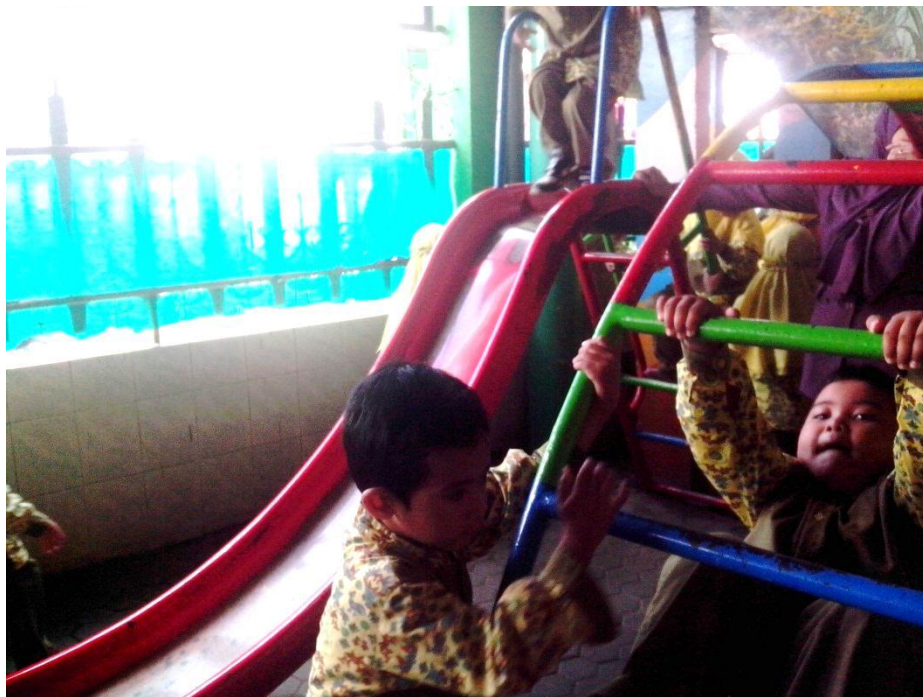
FOTO KEGIATAN DI LUAR KELAS