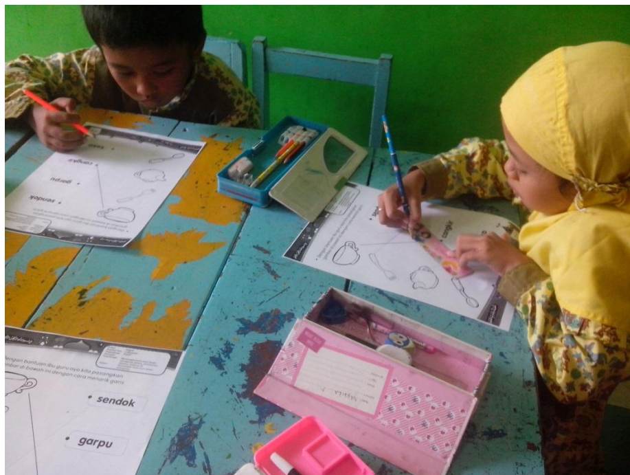
FOTO KEGIATAN MENGHUBUNGKAN GAMBAR DENGAN KATA