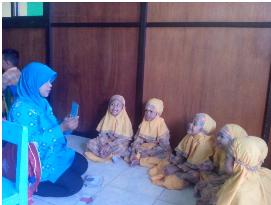
FOTO KEGIATAN MENGULANG CERITA BERGAMBAR