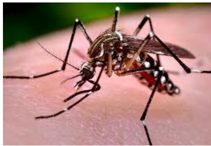
Gambar 2.5 Nyamuk dewasa Aedes aegypti http://vectorbase.org

Perut terdiri dari delapan ruas dan pada ruas-ruas tersebut terdapat bintik-bintik putih. Sayap berukuran 2,5-3,0 mm, bersisik hitam. Waktu istirahat posisi nyamuk Aedes aegypti ini tubuhnya sejajar dengan bidang permukaan yang dihinggapinya (Soegijanto, 2006).