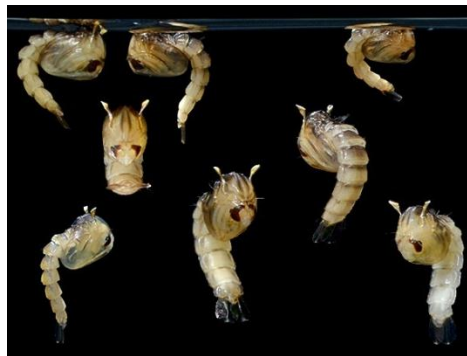
Gambar 2.4 Pupa Aedes aegypti http://eliminatedengue.com

Pupa nyamuk Aedes aegypti bentuk tubuhnya bengkok, dengan bagian kepala-dada (cephalothorax) lebih besar bila dibandingkan dengan bagian perutnya, sehingga tampak seperti tanda baca “koma”. Pada bagian punggung (dorsal) dada terdapat alat bernapas seperti terompet. Pada ruas perut ke-8 terdapat sepasang alat pengayuh yang berguna untuk berenang. Alat pengayuh tersebut berjumbai panjang dan bulu di nomor 7 pada ruas perut ke-8 tidak bercabang. Pupa tidak membutuhkan makanan sehingga disebut stadium istirahat ( Diapause ), tampak gerakannya pasif di dalam air. Waktu istirahat posisi pupa sejajar dengan bidang permukaan air (Soegijanto, 2006).