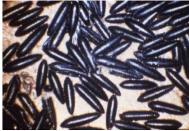
Gambar 2.3 Telur Aedes aegypti