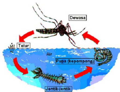
Gambar 2.6 Siklus hidup nyamuk Aedes aegypti

Pertumbuhan dan perkembangan telur, larva, pupa, sampai dewasa memerlukan waktu kurang lebih 7-14 hari. Nyamuk dewasa akan kawin dan nyamuk betina yang sudah dibuahi akan mengisap darah dalam 24-36 jam. Darah merupakan sumber protein yang esensial untuk mematangkan telur (WHO, 2004).