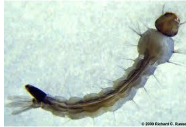
Gambar 2.4 Larva Aedes aegypti http://rinifitrianingsih.blogspot.com

Sama seperti instar III namun ukurannya lebih besar.