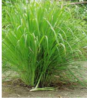
Gambar 2.1 Serai ( Cymbopogon nardus )

Memiliki akar serabut dan akarnya berwarna coklat muda (Muhlisah, 2000).