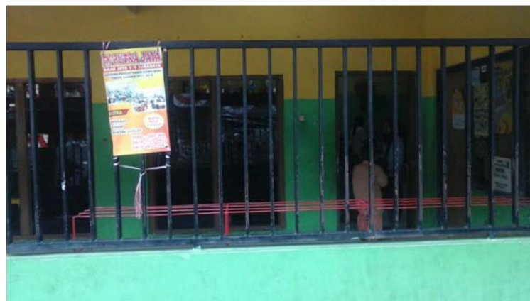
Gambar 3. Lokasi Samping Tempat Penelitian di PPT Permata Bunda Kecamatan Semampir Surabaya