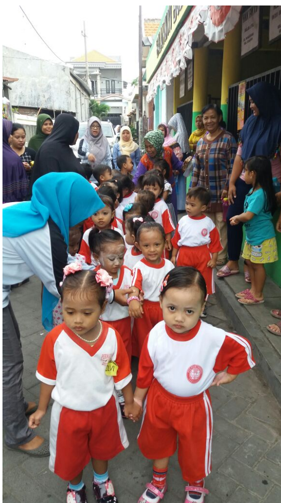
Gambar 4. Anak PPT Permata Bunda Sedang Berbaris di lapangan