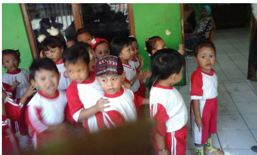
Gambar 5.. Anak PPT Permata Bunda Sedang Berbaris di depan kelas