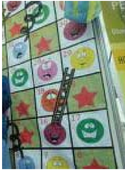
Gambar 8 Media Permainan Ular Tangga Emosi di Luar Kelas