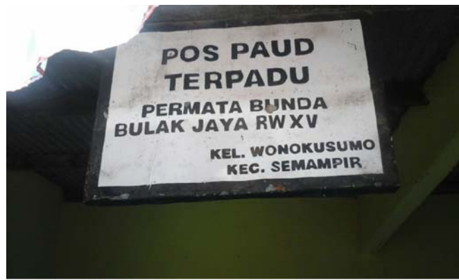
Gambar 1. Lokasi Tempat Penelitian di PPT Permata Bunda Kecamatan Semampir Surabaya