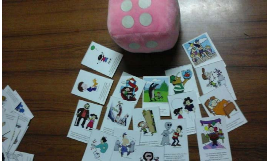
Gambar 11. Kartu tanya jawab yang digunakan saat permainan ular tangga