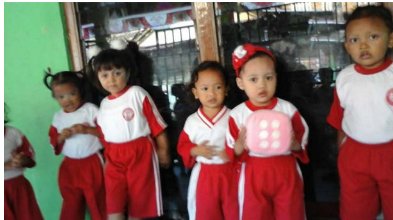
Gambar 10. Anak PPT Permata Bunda Sedang melempar dadu dalam permainan ular tangga