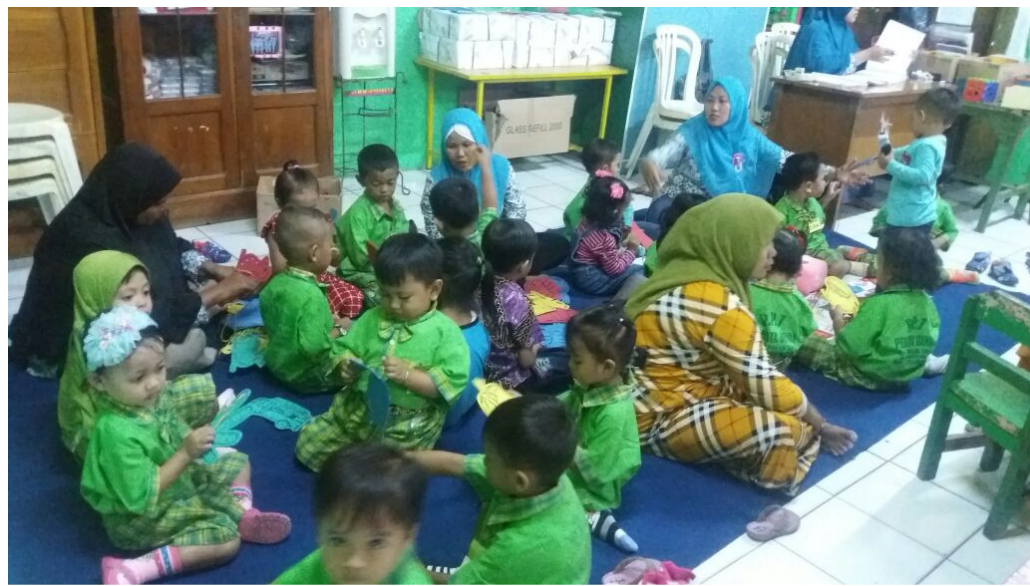
Gambar 7. Anak PPT Permata Bunda Kecamatan Semampir Surabaya sedang bersosialisasi dengan teman di dalam kelas