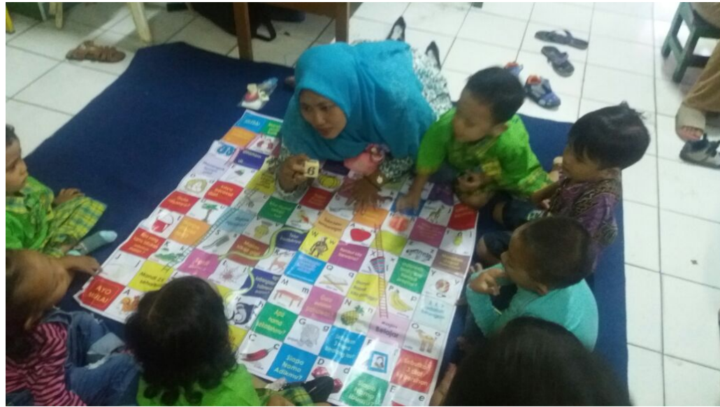
Gambar 6. Permainan Ular Tangga Emosi di dalam kelas PPT Permata Bunda Kecamatan Semampir Surabaya