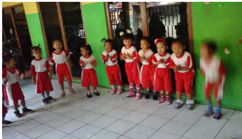
Gambar 9. Anak PPT Permata Bunda Sedang persiapan bermain ular tangga emosi di halaman