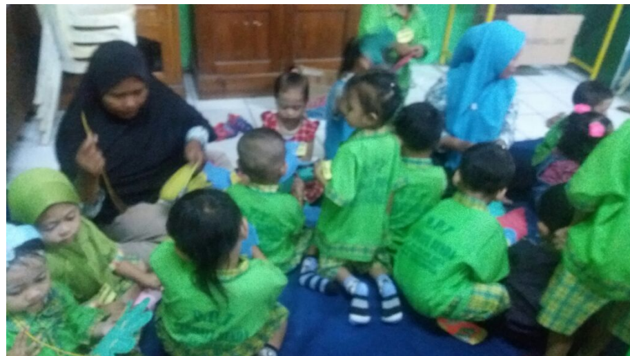
Gambar 12. Tanya Jawab Kartu Gambar emosi yang digunakan saat Permainan ular tangga