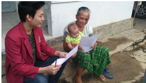
Dokumentasi kuesioner ke orang tua