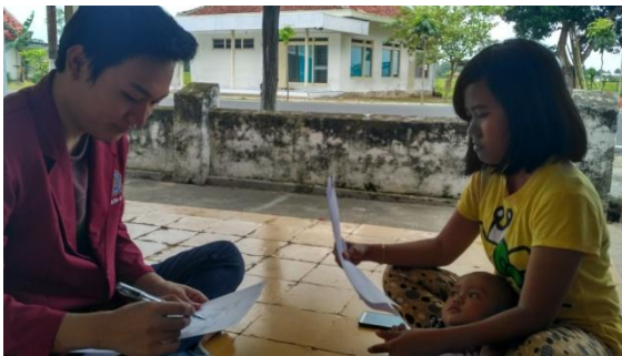
Dokumentasi kuesioner ke orang tua