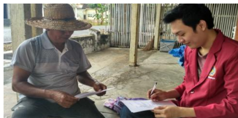
Dokumentasi kuesioner ke orang tua