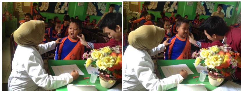
Dokumentasi observasi karies gigi Dokumentasi observasi karies gigi