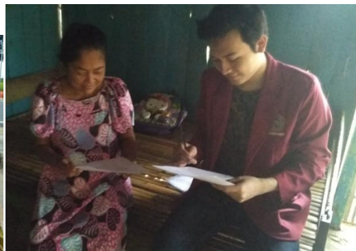
Dokumentasi kuesioner ke orang tua