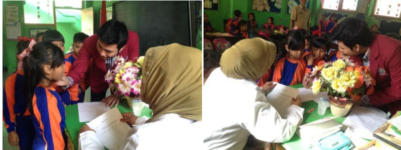
Dokumentasi observasi karies gigi Dokumentasi observasi karies gigi