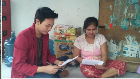
Dokumentasi kuesioner ke orang tua