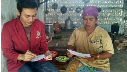
Dokumentasi kuesioner ke orang tua