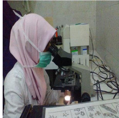
f. Pemeriksaan sedimen urine di mikroskop