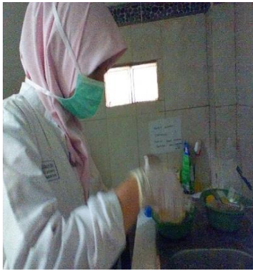
e. Buang urine setelah dicentrifuge