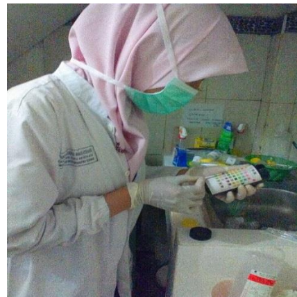
d. Pemeriksaan urine metode carik celup