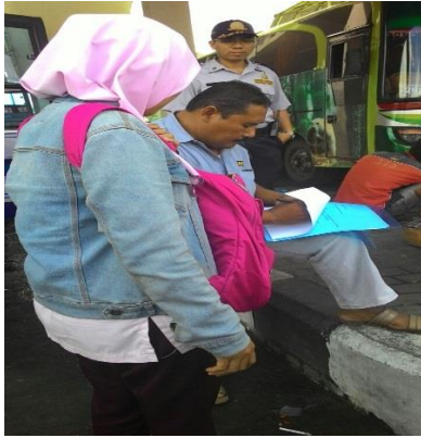
a. Pemberian kuisisioner pada sopir