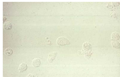
h. Sel leukosit dalam sedimen urine