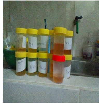
b. Sampel urine