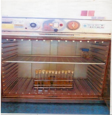
Gambar 3.1 proses inkubasi